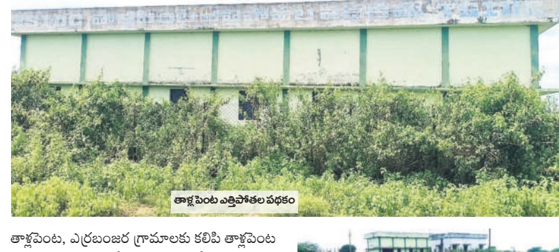
తాళ్ళపెంటు ఎత్తిపోతల పథకం