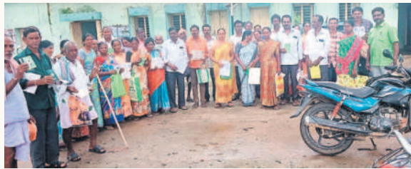
అశ్వాపురంలో రుణమాఫీపై ఫిర్యాదు చేసేందుకు వచ్చిన వివిధ గ్రామాల రైతులు

లోని పలు గ్రామాలకు చెందిన దాదాపు 200 మంది రైతులు సోమ వారం వ్యవసాయాధికారిని కలిసి ఫిర్యాదు చేయడంతోపాటు తమ గోడు వెళ్ళతోసుకున్నారు. పట్టణం పాస్ పుస్తకం లేని కారణంగా కొందరికి రుణమాఫీ జమ కాలేదని, రూ.2 లక్షల రుణం దాటి వారికి వర్తింపలేదని, బ్యాంకు అధికారులు, అధికారుల పాఠశాల కారణంగా మరికొందరు రుణాలు మాఫీ చేయాలని డిమాండ్ చేస్తూ భద్రాద్రి కొత్తగూడెం జిల్లా అశ్వాపురం మండలం దరి రుణాలు మాఫీ చేయాలని డిమాండ్ చేస్తూ భద్రాద్రి కొత్తగూడెం జిల్లా అశ్వాపురం మండలం దరికి రుణమాఫీ కాలేదంటూ ఫిర్యాదులు సమర్పించారు. ఈ సందర్భంగా పలువురు రైతులు మాట్లాడుతూ ప్రభుత్వం చెప్పిన విధంగా తమ పంట రుణం మాఫీ అవుతుందని ఎంతగానో ఎదురుచూసినా నిరాశ మిగిలినదన్నారు. గత కేసీఆర్ ప్రభుత్వ హయాంలో తాము ఏ అధికారి చుట్టూ తిరగకుండానే రుణమాఫీ వర్తిందినవి, ప్రస్తుత కాంగ్రెస్ ప్రభుత్వం మాత్రం పండగపూట కూడా ఇంటి వద్ద ప్రశాంతంగా ఉండనేయకుండా అధికారుల చుట్టూ ప్రదర్శనలు చేయవలసిందేనని దాడులు చేస్తున్నారని, వెంటనే ప్రభుత్వం పెట్టిన షరతులను తొలగించి నూరు శాతం రుణమాఫీ వర్తింపజేయాలని, లేదంటే ఆందోళన ఏకమై పెద్ద పెద్ద ఉద్యమాలు చేపడతామని రైతులు హెచ్చరించారు.