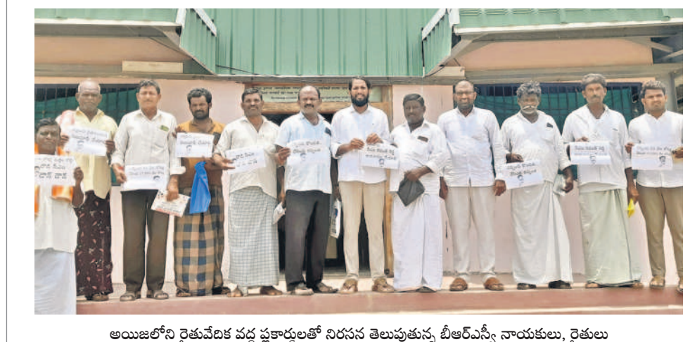
అయిజలోని రైతువేదిక వద్ద కార్యకర్తలతో నిరసన తెలుపుతున్న బీఆర్ఎస్ నాయకులు, రైతులు

అయిజ, ఆగస్టు 19 : ఆరుగలం వ్యవసాయం చేస్తున్న రైతులకు మాయమౌతులు చెప్పి అధికారంలోకి వచ్చిన సీఎం రేవంత్ రైతులకు అండగా ఉండటం లేదు. బీఆర్ఎస్ జిల్లా నాయకులు కురుమ పల్లయ్య అన్నారు. రైతులను బ్యాంకులు, వ్యవసాయశాఖ కార్యాలయాల చుట్టూ తిప్పుతూ రైతు నోట్ల మట్టి కొట్టారని ఆరోపించారు. అసెంబ్లీ, పార్లమెంట్ ఎన్నికల సందర్భంగా రైతులకు మొత్తం రుణాలు మాఫీ చేస్తామని దీవెనలు పెట్టడం వల్ల సీఎం రేవంత్ రైతులకు అండగా ఉండటం లేదు. సోమవారం పట్టణంలోని మార్కెట్ యార్డులోని రైతు వేదిక వద్ద రుణమాఫీ కాని రైతులతో కలిసి నిరసన తెలిపారు. 100 తర్రా లోనే ఆరు గ్యారంటీలను అమలు చేసి తీరుతామని చెప్పిన