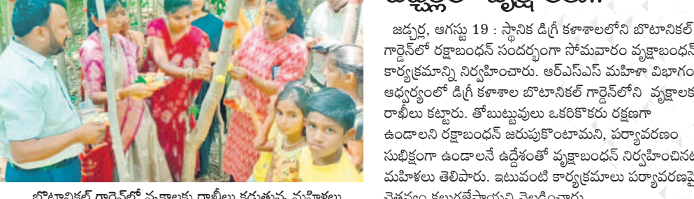
బోటానికల్ గార్డెన్లో వృక్షాలకు రాబోయే కడుతున్న మహిళలు

ఉమ్మడి పాలమూరు జిల్లాలోని ప్రజలు రక్షణం ధన ఘనంగా జరుపుకొన్నారు. తోబుట్టువులకు సోదరీమణులు రాబోయే కట్టారు. ఆత్మీయ బంధానికి ప్రతీకగా నిర్వహించే పండుగను సంకేత పుణ్య నిర్వహించారు. వివిధ ప్రాంతాల నుంచి ఆడపడుచులు