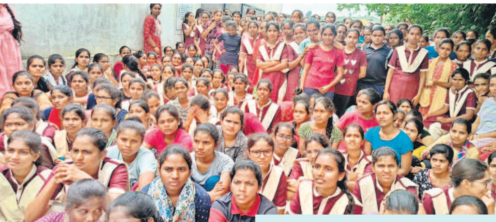
గురుకులం వద్ద అందోళ్ళ చేస్తున్న విద్యార్థినులు

పండుగ పబ్లిం లేకుండా తిరుగుతున్నాం ప్రభుత్వం రైతులకు ఏకకాలంలో రూ. రెండు లక్షల వరకు రుణమాఫీ చేస్తామంటే పట్టణం చెబుతున్నారని అనిపించింది. కానీ ఆరు నెలల నుంచి ఇప్పుడు, అప్పుడు అని రుణమాఫీ కోసం ఎదురుచూసినా తీరా గత నెల నుంచి రుణమాఫీ ప్రకటన టీవీలో చూసి నేను, నా భార్య తీసుకున్న క్రాఫ్ లోన్ రూ. లక్షా డెబ్బై వేలు, లక్షా అరవై వేలలో ఏదో ఒకటి మాడు విడుదల మాఫీ అవుతుందని అనుకున్నాం. కానీ రూ. రెండు లక్షల రుణమాఫీ లిస్టులో మా పేరు రాలేదని వ్యవసాయశాఖ, బ్యాంకు అధి