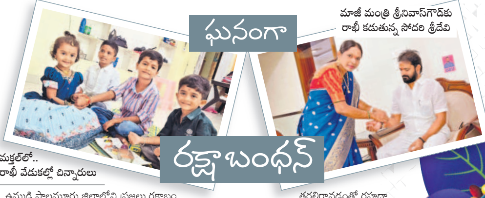
మళ్ళీ వేడుకల్లో చిన్నారులు

ఉమ్మడి పాలమూరు జిల్లాలోని ప్రజలు రక్షణం ధన ఘనంగా జరుపుకొన్నారు. తోబుట్టువులకు సోదరీమణులు రాబోయే కట్టారు. ఆత్మీయ బంధానికి ప్రతీకగా నిర్వహించే పండుగను సంకేత పుణ్య నిర్వహించారు. వివిధ ప్రాంతాల నుంచి ఆడపడుచులు