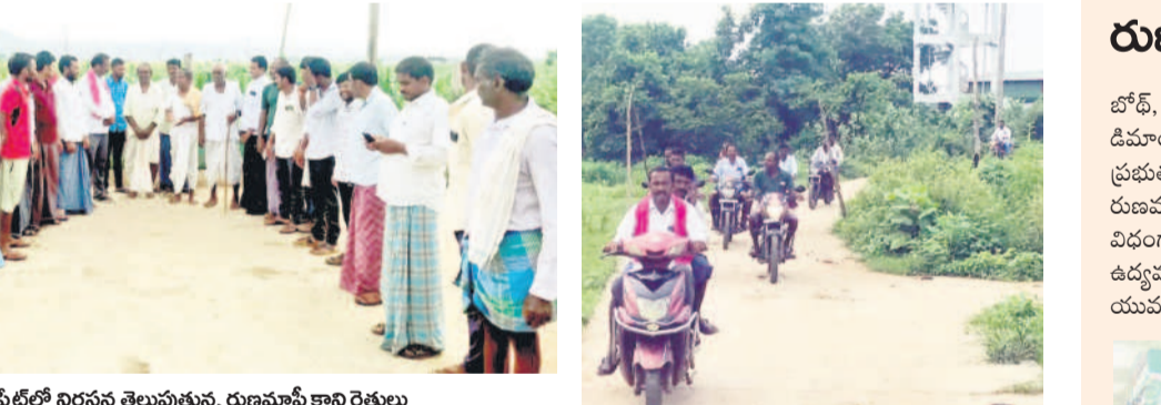
సోమవారం నిరసన తెలుపుతున్న రుణమాఫీ కాని రైతులు