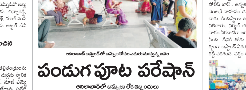
ఆదిలాబాద్ బస్టాండ్ లో బస్సులతో సంఘం ఎదురుచూస్తున్న జనం