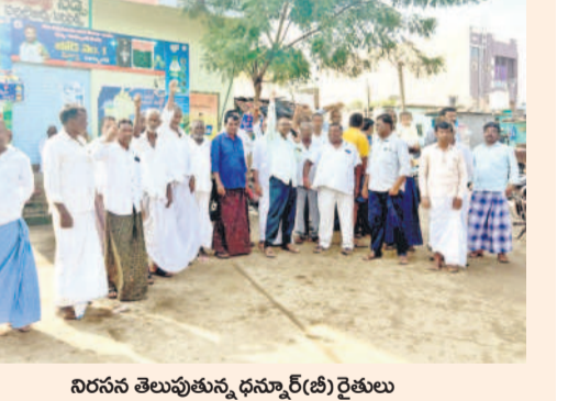
నిరసన తెలుపుతున్న ధన్నూర్(టి) రైతులు

బోధో, ఆగస్టు 19 : ధన్నూర్(టి) గ్రామంలో రైతులు రుణమాఫీ చేయాలని డిమాండ్ చేస్తూ సోమవారం బస్టాండ్ వద్ద నిరసన వ్యక్తం చేశారు. రాష్ట్ర ప్రభుత్వం వీలైనంత త్వరగా అర్హులైన ప్రతి ఒక్క రైతుకు రూ.2 లక్షల రుణమాఫీ చేయాలని డిమాండ్ చేశారు. ఎన్నికల సమయంలో చెప్పిన విధంగా రూ.2 లక్షలు రుణమాఫీ వర్తింపజేయాలన్నారు. లేని పక్షంలో ఉద్యమాన్ని తీవ్రతరం చేస్తామని తెలిపారు. కార్యక్రమంలో రైతులు, యువకులు పాల్గొన్నారు.