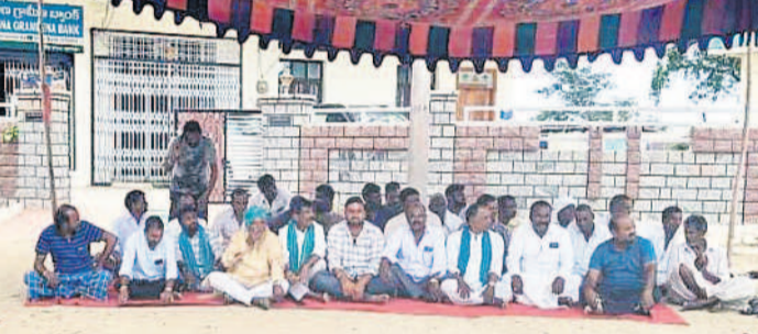
అర్బుల్ మండలం దేగాం గ్రామంలోని తెలంగాణ గ్రామీణ బ్యాంక్ ఎదుట నిరసన తెలుపుతున్న రైతులు

రుణమాఫీ కోసం రైతులు లోడ్లుకొన్నారు. మాకెందుకు మాఫీ కాలేదని ఆందోళనలకు దిగారు. సోమవారం నిజామాబాద్, కామారెడ్డి జిల్లాల్లోని పలు ప్రాంతాల్లో అన్నదాతల ధర్నాలు, ఆందోళనలు మిన్నంటాయి. అంక్షలేకుండా రుణమాఫీ అమలు చేయాలని డిమాండ్ చేస్తూ నిరసనలు చేపట్టారు. పాల్గా సాస్ట్రోని రైతులు ముట్టడించారు. నందిపేట్ మండలం వెల్లూర్లో అన్నదాతలు రాస్తారాకో చేశారు. మూడో జాబితాలోనూ తమ పేరు లేదని ఆవేదనకు లోనైన రైతులు మంగళవారం సిండికేట్ బ్యాంక్ ఎదుట ఆందోళనకు దిగారు. దేగాంలోని బ్యాంక్ ఎదుట రైతులు టింట్ చేసుకుని బ్రాయించారు. పట్టణం మండలం పెద్ద రాంపూర్లోనూ రైతులు నిరసన చేపట్టారు.