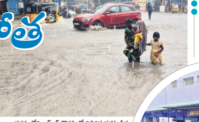
నగరంలోని ఆర్ఆర్ వార్డులో నిలిచిన వర్షపు నీరు