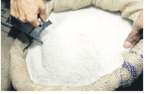
కామారెడ్డిలో బియ్యం త్రీసు హవా..

నిజామాబాద్, ఆగస్టు 19 (నమస్తే తెలంగాణ ప్రతినిధి) ఉమ్మడి జిల్లాలో పీడిషన్ బియ్యం దండా జోరుగా సాగుతున్నది. నిరుపేదల కడుపులు నింపాలన్న బియ్యం సరిహద్దులు దాటిపోతున్నది. కనిపించని నిఘా, అధికారుల నిర్లక్ష్యం వైఖరి మూలంగా అక్రమార్కులకు అడ్డే లేకుండా పోయింది. నిజామాబాద్, కామారెడ్డి జిల్లాల్లోని కీలక ప్రాంతాలే అడ్డంగా ఉండి బియ్యం దండా అడ్డుఅడుపు లేకుండా కొనసాగుతున్నది. పేదల కొసం నిర్దేశించిన రేషన్ బియ్యాన్ని ఉభయ జిల్లాల్లోని కీలకమైన రైస్ మిల్లలకు చేరుతున్నాయి. అక్కడ పీడిషన్ బియ్యాన్ని పాల్గొనే పట్టి సన్నబియ్యంగా మార్చి మార్కెట్ కు తరలించి నిమ్మూ చేసుకుంటున్నారు. మరోవైపు, సీఎంఆర్ రూపంలో ప్రభుత్వానికి అటంకం ఉంటున్నాయి. పేదల బియ్యాన్ని పందికొక్కల్లా మేస్తున్న అక్రమార్కులకు కొందరు అధికారులు మద్దతుగా నిలుస్తున్నారు. అక్రమాలను అరికట్టేందుకు నియమించిన డిప్యూటీ తహసీల్దార్లు ఉత్సవ విగ్రహాల్లాగా మారారు. ముప్పాల్గా తనిఖీలే లేకుండా పోయాయి.