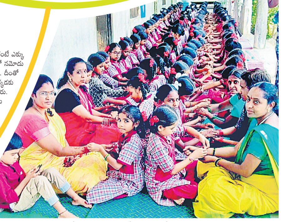
ముప్పాల్ మండలంపెద్దరాంపూర్లోని కస్తూర్బా పాఠశాలలో రజాబందనలో పాల్గొన్న ఉపాధ్యాయులు, విద్యార్థినులు

ను కలిసి ఆరా తీయారు, తీసుకున్న రుణానికంటే ఎక్కువగా తీసుకున్నట్లు వ్యవసాయ శాఖ లాగిన్లో సమాచారం కావడంతో రుణమాఫీ వర్తించలేదని తెలిసింది. దీంతో రైతులు సాస్ట్రోని గేటుకు తాళం వేశారు. అక్కడకు వచ్చిన సాస్ట్రోని సీకవో రాకేను నిలదీశారు. సాస్ట్రోని రికార్డులో రైతులకు పొందిన రుణాలు సరిగ్గానే ఉన్నాయని, ఏకవో లాగిన్లో (బిస్కెట్లో) ఎక్కువగా రుణం పొందినట్లు తప్పుగా సమాచారం ఆయన వివరించారు. దీంతో సహకార శాఖ జిల్లా అధికారులను ఉబ్బడికీ పిలిపించాలని రైతులు పట్టుబట్టారు. అధికారులు స్పందించకపోతే ప్రతిరోజూ సాస్ట్రోనికి వచ్చి అందోళన కొనసాగిస్తామని రైతులు స్పష్టం చేశారు.