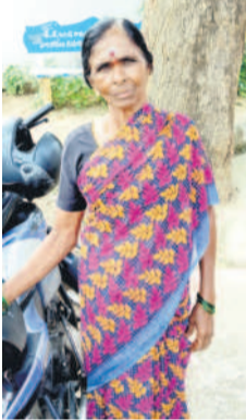
- అన్నం రాజువ్వ రైతు

చిగురుమామిడి బ్యాంకుల క్రాఫ్టర్లను ₹70 వేలు తీసుకున్నా నాకు రుణమాఫీ కారణమేదని మాఫీ చేస్తు లేరు. మా ఇంట్లో ఎవల పేరు మీద అప్పులేదు. నన్ను కరీంనగర్.. చిగురుమామిడికి అని చెప్పినారు. మా ఇంట్లో అయినా తమ అప్పులు సేవోక్కాన్ని ఏడికిపోవాలి. కన్నారం పోతే తెల్లకాఫీను ఎక్కడుంటే తెల్లకాఫీ. అడికిపోయి అట్టేకేషన్ పెట్టుకోవచ్చునే నేనెప్పుడూ పాలి. అడికి పోవాలని నిన్నామొన్నటి సందే అంటున్నారు. అంతకు ముందు నాకు తెల్లని తెల్లని. అత్త పెట్టి లేకుంటే లేదని ఒక్కసారి చేసుకున్నా. అప్పు నా బిడ్డ పెట్టి చేసినా, కొడుకు పెండ్లికి చెన్నారా.. పంట మీదనేగదా చేసింది. పంట మీద తీసుకున్నారా.. లేదా అని చూసి మాఫీ చేయాలిగాని కొపెన కారణం లేదని అప్పుడేంది. నేను కరీంనగర్ పోను చిగురుమామిడికి వచ్చా. ఇది చెన్నారాడేవో నా దగ్గరే రావాలి. వాళ్ల సంగతి చూడాలి.