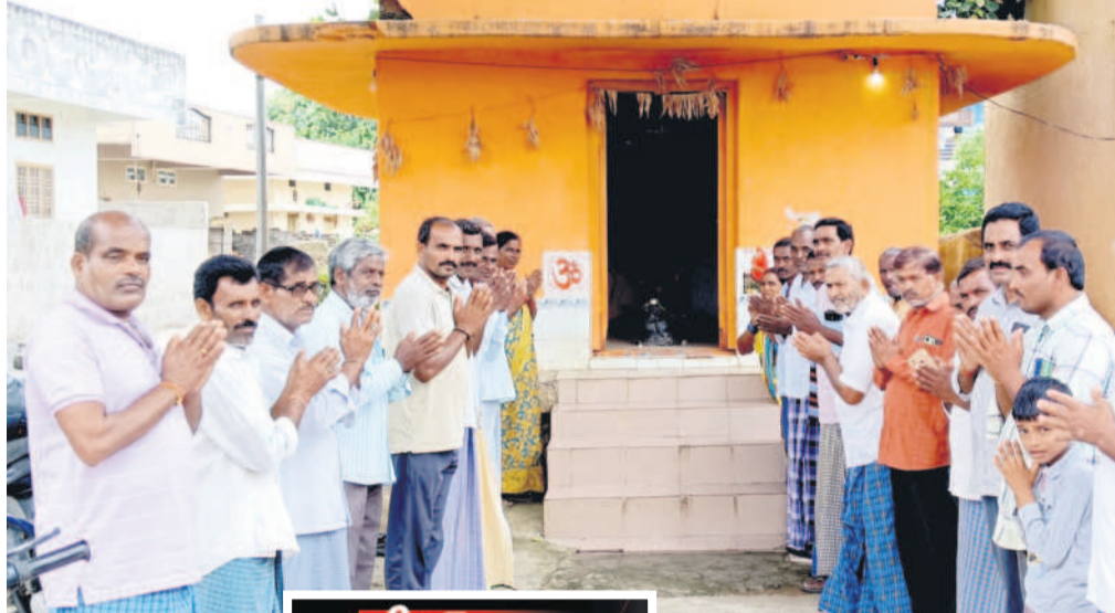
చిగురుమామిడి మండలం సీతారాంపూర్ లోని హన్మంట్ దేవాలయంలో సీం రేవంత్ రెడ్డి మనసు మార్చాలని కోరుతూ మొక్కుతున్న రైతులు