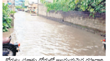
కోరుట్ల: ప్రకాశం రోడ్డులో జలమయమైన రహదారి

జగిత్యాల టౌన్ / కోరుట్ల / వేములవాడ రూరల్, ఆగస్టు 19 : ఉమ్మడి కరీంనగర్ జిల్లాలలో సోమవారం జోరువాస వడింది. మధ్యాహ్నం తర్వాత అక్కడక్కడా కుండపోత కురిసింది. లోతట్లు ప్రాంతాలు జలమయమయ్యాయి. జగిత్యాల, కోరుట్ల పట్టణాల్లోని పలు కాలనీలు నీటమునిగాయి. గట్టి రోడ్లు కాలువలను తలపించాయి. అండ్లలోకి నీరు చేరడంతో కాలనీలవాసులు అవస్థలు పడారు. జగిత్యాలలో అత్యధికంగా 60.8 మిల్లీమీటర్ల వర్షపాతం నమోదు కాగా, జగిత్యాల రూరల్ మండలం పొలాలో 58.5, పెగడపల్లి మండలంలో 48.0, కోరుట్లలో 48.0, మేపల్లి మండలం జగిత్యాలలో 46.3, రాయలకల్ మండలం అల్మోసలో 31.0 మిల్లీమీటర్ల వర్షం పడింది. జగిత్యాల జిల్లా కేంద్రంలో గంట పాటు భారీ వర్షం కురు పడడంతో రోడ్లన్నీ జలమయమయ్యాయి. పట్టణంలోకి దూరం క్యాంపు, హోసని బోర్డు, తీసివని, టవర్సర్కిల్, సాగుగమ్యవీధి, మార్కెట్ యెన్గర్ ప్రాంతాల్లో రోడ్లన్నీ కాలువల్లా ఉప్పొంగాయి. రెండు గంటల పాటు రాకపోకలు స్తబ్ధించిపోయాయి. కోరుట్లలో కురిసి