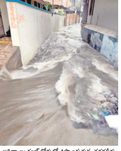
జగిత్యాల: గంజ్ రోడ్డులో ఉప్పొంగుతున్న వరదనీరు