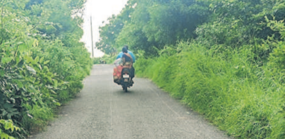
మర్చిలీ నుంచి పంచలింగాల రోడ్డుకు ఇరువైపులా ఏర్పాటు చేసిన కలుపు మొక్కలు