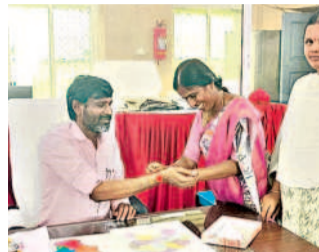
కోడంగల్: తహసీల్దార్ రాజీ కడుతున్న డిప్యూటీ తహసీల్దార్