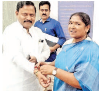
పరిగి: ఎమ్మెల్యే రామ్మోహన్రెడ్డికి రాజీ కడుతున్న మంత్రి సీతక్క