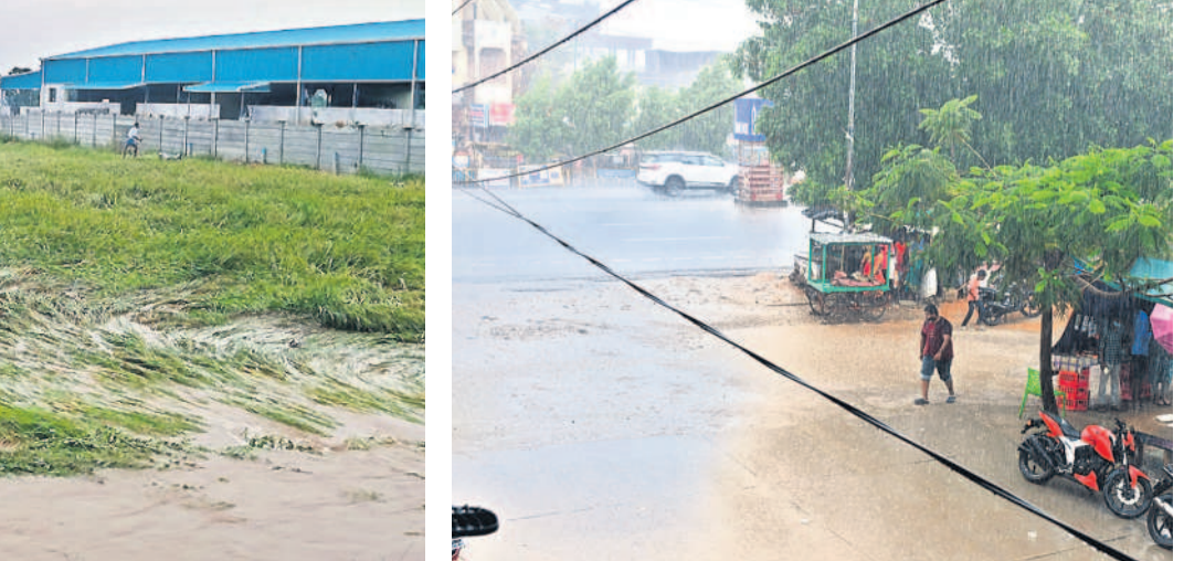
చౌటుప్పల్లో కురుస్తున్న వర్షం

వాడిపోతున్న సమయంలో వర్షం రావడంతో రైతులు ఊపిరి పీల్చుకున్నారు. భారీ వర్షంతో స్వామి వారి దర్శనానికి వచ్చిన భక్తులకు కొద్ది సమయం ఉబ్బంది ఏర్పడింది. కొండకింద పార్కింగ్లో నిలిపి వాహనాలు వర్షపు నీటిలో కొద్దిమేర మునిగాయి. గుట్టలో 25 మిల్లీమీటర్ల వర్షపాతం సమాధానం అధికారులు తెలిపారు.