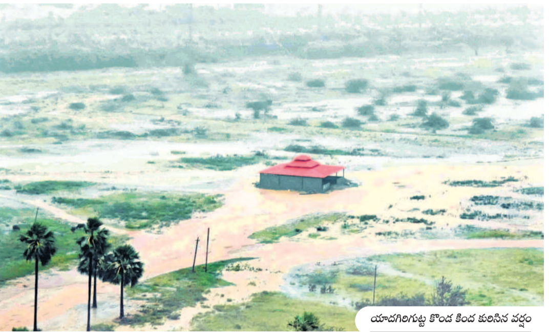
యాదాద్రిగిరిపట్టణం కొండ కింద కురిసిన వర్షం

వాడిపోతున్న సమయంలో వర్షం రావడంతో రైతులు ఊపిరి పీల్చుకున్నారు. భారీ వర్షంతో స్వామి వారి దర్శనానికి వచ్చిన భక్తులకు కొద్ది సమయం ఉబ్బంది ఏర్పడింది. కొండకింద పార్కింగ్లో నిలిపి వాహనాలు వర్షపు నీటిలో కొద్దిమేర మునిగాయి. గుట్టలో 25 మిల్లీమీటర్ల వర్షపాతం సమాధానం అధికారులు తెలిపారు.