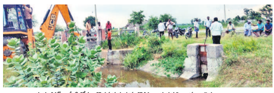
గుర్రంపాడ : నీటి కోసం గొడవ పడుతున్న కొప్పోలు, తుర్కపల్లి గ్రామాల రైతులు

రాజాపీట పీఏసీఎస్ పరిధిలో పూర్తిస్థాయిలో రుణమాఫీ కాలేదు. నగం మందికి మాత్రమే బ్యాంక్ ఖాతాల్లో డబ్బులు జమ అయ్యాయి. ఇక్కడ 1,292 మందికి మాఫీకి అర్హులుగా గుర్తించారు. కానీ ఇప్పటి వరకు 805 మందికి మాత్రమే మాఫీ అయ్యింది. మొదటి విడుదలలో 441 మంది రైతులకు (2.50 కోట్లు), రెండో విడుదలలో 261 మందికి (2.61 కోట్లు), మూడో విడుదలలో 103 మందికి (80.80 లక్షలు) మాఫీ చేశారు. ఇంకా 487 మందికి పెండింగ్లో పెట్టారు. ప్రస్తుతం ఇంకా మొదటి, రెండో విడుదలలో నామినేషన్ వారికి మాత్రమే మాఫీ అవుతున్నట్లు తెలుస్తున్నది. మిగతావారికి ఎప్పుడు అవుతాయో..? అలా అవుతాయో.. లేదో.. కూడా స్పష్టత లేదు.