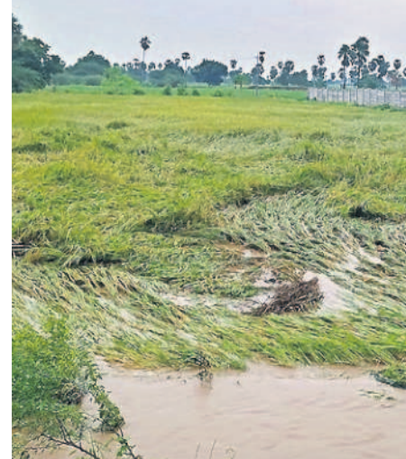
సంస్థాననారాయణపురం : వాచిక్షపల్లి గ్రామంలో నీటి మునిగిన వరి చేసే

యాదాద్రిగిరిపట్టణం/చౌటుప్పల్/భువనగిరి సిటీ/సంస్థాననారాయణపురం, ఆగస్టు 19 : జిల్లావ్యాప్తంగా మోస్తరు నుంచి భారీ వర్షం కురిసింది. యాదాద్రిగిరి గుట్ట పట్టణంతోపాటు పలు గ్రామాల్లో సోమవారం సుమారు గంటన్నర పాటు కురిసిన వర్షానికి లోతట్టు ప్రాంతాలు జలమయమయ్యాయి. ఉరుములు, మెరుపులతో కూడిన వర్షంతో పలు ప్రాంతాల్లో విద్యుత్తు అంతరాయం ఏర్పడింది. వారంకోసం బాగా ఎండకాలం వూడిందిగా ఉన్న వాతావరణం ఒక్కసారిగా చల్లబడింది. వర్షం కోసం ఎదురుచూస్తున్న రైతులకు ఇది అనుకూలంగా మారింది. పత్తి తీర్మాల్ని ఉంది. అయితే వేసవిలో నీటి లభ్యత సరిగ్గా లేని నేపథ్యంలో రెండు లేదా మూడు మోటార్ల నడపే కేవలం తాగునీటి అవసరాలకే అందిస్తుంటారు. అయితే ఇదే సమయంలో నడపని మోటార్ల రివేర్స్ లేదా మెంయిటినెన్స్ పనులు ఉంటే సీజన్ ప్రారంభానికి పూర్తి చేయాల్సి ఉంటుంది. దీనివల్ల జాతి చివర లేదా ఆగస్టు ప్రారంభంలో సాగర్ కు వరద వస్తే నాలుగు మోటార్ల ద్వారా నీటిని ఎత్తిపోసి తాగు, సాగునీటి అవసరాలకు ఉపయోగించవచ్చు.