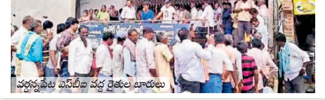
వడ్లన్నపేట వినోదీ వద్ద రైతుల భారాలు

తీతంగా ఏకమై రోడ్లెక్కి ప్రభుత్వానికి, అధికార పార్టీలకు పాలకమండలికి వ్యతిరేకంగా నినాదాలు చేశారు. సంగం మండలంలోని వివిధ బ్యాంకుల్లో పంట రుణాలు తీసుకున్న రైతులకు రుణమాఫీ వర్తిస్తే కాపులకనపర్తి, చింతలపల్లి సాస్తిలేలో తీసుకున్న ఏ రైతుకూ మాఫీ వర్తింపజేయవలం అనార్యమని మండిపడ్డారు. తక్షణమే రుణమాఫీ చేయకపోతే ఆంధ్రోళ్లను ఉధృతం చేస్తామని హెచ్చరించారు.