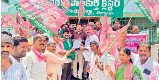
పాలకల్లె రూరల్: రుణమాఫీ చేయాలంటూ ఏపీజీవీవీ వినతి పత్రం అందజేస్తున్న బీఆర్ఎస్ శ్రేణులు

జనగామ, ఆగస్టు 20 (నమస్తే తెలంగాణ) : ఎన్నికల ముందు కాంగ్రెస్ పార్టీ ఇచ్చిన హామీ మేరకు 2014 నుంచి 2023 వరకు రూ.2 లక్షలకు పైబడిన రుణాలను మాఫీ చేసి వెంటనే కొత్త రుణాలివ్వాలని తెలంగాణ రైతు సంఘం జిల్లా కమిటీ డిమాండ్ చేసింది. మంగళవారం జనగామ సమీప కలెక్టరేట్ కార్యాలయం ఎదుట రైతులతో కలిసి