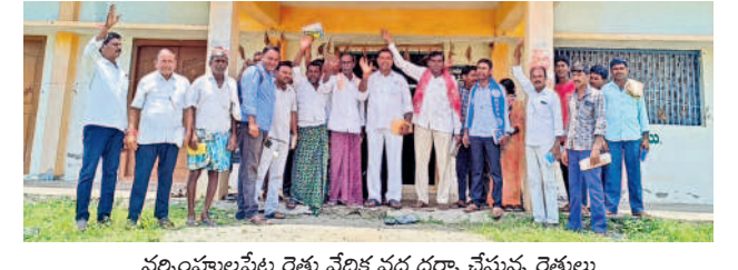
నర్సంపాలపేట రైతు వేదిక వద్ద ధర్నా చేస్తున్న రైతులు

సంగం, ఆగస్టు 20 : రుణమాఫీ కోరేదని కాపులకనపర్తి సాస్తిలే పరిధిలోని రైతులు మంగళవారం సంగం మండలం గవిపర్లలోని వరంగల్ - నెక్సోడ్ ప్రధానరోడ్డులో రాస్తారోకో చేశారు. సాస్తిలేలో 1907 మంది రుణాలు తీసుకుంటే మూడు విడకల్లో ఏ ఒక్కరికీ మాఫీ కాదని నిరసన తెలిపారు. అర్జున రైతులందరికీ ప్రభుత్వం రుణమాఫీ వర్తింపజేయాలని వారు డిమాండ్ చేశారు. పార్టీలక