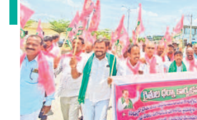
పాలకల్లెలో ధర్నా చేస్తున్న బీఆర్ఎస్ నాయకులు, కార్యకర్తలు