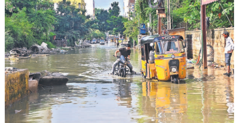
భారీ వర్షానికి అధికారంలో కాలనీలో రోడ్డు నీలవిన వరదనరు

సిటీబ్యూరో, ఆగస్టు 20 (నమస్తే తెలంగాణ) : వాహనదారులు మంగళవారం ట్రాఫిక్ వలయంలో చిక్కుకుని కుదలయ్యారు. కిలోమీటర్ల మేర వాహనాలు స్టంబిలిపోవడంతో రోడ్లపై బిక్కుబిక్కు మంటూ గడిచారు. 20 నిమిషాల్లో గమ్యం చేతే మార్గాల్లో వాహనదారులు గంటల తరబడి రోడ్లపై ఎదురుచూశారు. నగరంలో కురుస్తున్న భారీ వర్షానికి వాహనదారులు అతలాకుతలమయ్యారు. మంగళవారం తెల్లవారు జాము 8 గంటలకు మొదలైన కుంభవృష్టి ఉదయం 7 గంటల వరకు ఏకదాటిగా కురిసింది. అర్ధరాత్రి వరకు విడతల వారీగా నగరాన్ని భారీ వర్షం కుడిపెసింది. గుడి, బడి, ఆసుపత్రి, వాస్టీలు, కాలనీలు తేడా లేకుండా వరదనీరు ముంచెత్తింది. నాలా ఏదో, రోడ్లదో గుర్తు పట్టునంతగా దారులు ఏరులయ్యాయి. రోడ్లపై నదులను తలపించాయి. ఉప్పల్, బోడుప్పల్, పిల్లారాజు, హైటెక్ సిటీ, బంజారాహిల్స్, కోలి, అబ్బిడ్డ, గచ్చిబౌలి, రాయదుర్గం, గండిపేట, ఎల్వీనగర్, సాగర్ రింగ్ రోడ్లు, నాగోలు, బేగంపేట తదితర ప్రాంతాల్లో రోడ్లపై జలయముయ్యాయి. అంబర్పేట, మలకేపేట, డబ్లిర్పూరా, నల్లగొండ ఎక్స్ రోడ్లు, చాదర్పూట్, గోల్కాక, జూబ్లీహిల్స్ చెక్పోస్టు, హైటెక్సిటీ, బంజారా హిల్స్, అమీర్పేట, మైత్రివనం ప్రాంతాల్లో భారీగా ట్రాఫిక్ జామ్ ఏర్పడింది.