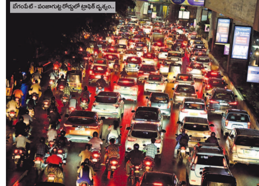
బేగంపేట్ - బంజారాగుట్ట రోడ్లలో ట్రాఫిక్ దృశ్యం..

భారీ వర్షం కారణంగా రోడ్లు పైనే నీరు నిలువడంతో వాహనాల రాకపోకలు నెమ్మదిగాయాయి. భారీ వర్షానికి తోడు మురుగునీరు రోడ్లపై ప్రవహించడంతో వాహన చోదకులకు సాయం త్రమే చుక్కలు కనిపించాయి. హైటెక్ సిటీ నుంచి జూబ్లీహిల్స్ చెక్పోస్టు వరకు రెండు వైపులా వాహనాలు భారీగా నిలిచిపోయాయి. తాడేపల్లి, బోయిస్ పల్లి, న్యూలోయిస్ పల్లి, సుచిత్ర మార్గంలో రాకపోకలు కొనసాగింది ప్రయాణికులు, వాహనచోదకులు నానా ఇబ్బందులు పడ్డారు. జిల్లాల నుంచి వస్తున్న ఆర్టీసీ బస్సులు, తొందరగా వెళ్లాలనుకున్న సరుకు వాహనాలు, ఆటోలు, కార్లు ట్రాఫిక్ జాంట్ చిక్కుకున్నాయి. దీంతో ప్రయాణికులు మెట్రి పు ఆశ్రయించడంతో స్టేషన్లపై కిక్కిరిసిపోయాయి.