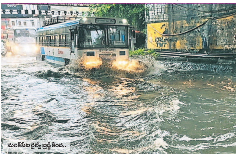
మలకేపేట రైల్వే స్టేషన్లో..

భారీ వర్షాల కురుస్తుండటంతో నగరంలోని వివిధ ప్రాంతాల్లో అంధకారం నెలకొంది. కొన్ని చోట్ల కరెంటు వైర్లు తెగివచ్చాయి. సికింద్రాబాద్ లోని మైలాపాట్ గడ్డ, సీతాపత్రం, ఉప్పల్, మేడిపల్లి తదితర ప్రాంతాల్లో కుండపోత వర్షం పడటంతో విద్యుత్ సరఫరా నిలిచిపోయిందని స్థానికులు తెలిపారు.