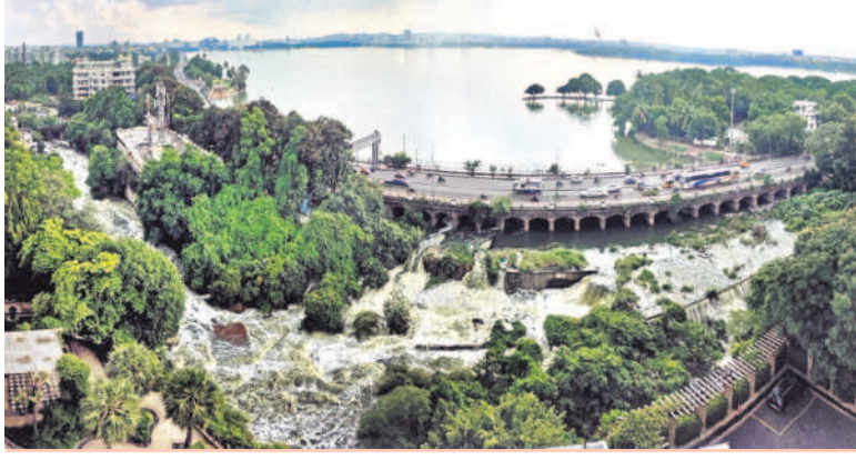
హుస్సేన్ సాగర్ పరవళ్లు.. మంగళవారం కురిసిన భారీ వర్షంతో హుస్సేన్ సాగర్లో ఇన్ఫ్లో పెరిగింది. దీంతో అధికారులు నీటిని దిగువకు వదిలారు