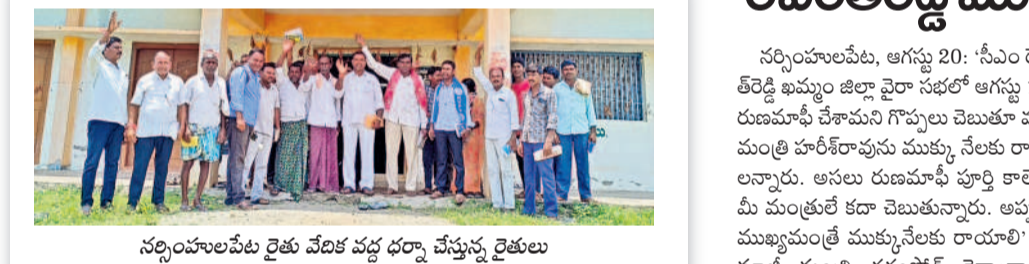
నర్సంపాలపేట రైతు వేదిక వద్ద ధర్మా చేస్తున్న రైతులు

సంగం, ఆగస్టు 20 : రుణమాఫీ కోసం రైతులు మంగళవారం సంగం మండలం గవిపల్లెలోని వరంగల్ - నెక్స్ట్ ప్రధాన రోడ్డులో రాస్తారోకో చేశారు. సాన్లెట్లో 1907 మంది రుణాలు తీసుకుంటే మూడు విడతల్లో ఏ ఒక్కరికీ మాఫీ కాలేదని నిరసన తెలిపారు. అప్పులైన రైతులందరికీ ప్రభుత్వం రుణమాఫీ వర్తింప జేయాలని వారు డిమాండ్ చేశారు. పార్టీలక