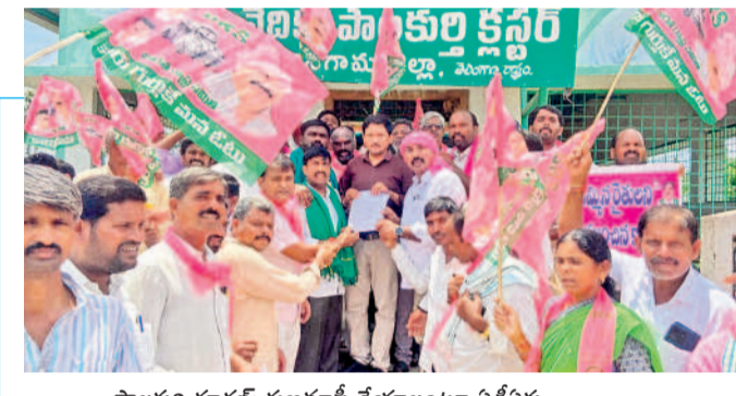
పాలకుల్లో ధర్మా చేస్తున్న బీఆర్ఎస్ నాయకులు, కార్యకర్తలు

జనగామ, ఆగస్టు 20 (నమస్తే తెలంగాణ) : ఎన్నికల ముందు కాంగ్రెస్ పార్టీ ఇచ్చిన హామీ మేరకు 2014 నుంచి 2023 వరకు రూ.2 లక్షల రుణాలను రుణాలను మాఫీ చేసి వెంటనే కొత్త రుణాలివ్వాలని తెలంగాణ రైతు సంఘం జిల్లా కమిటీ డిమాండ్ చేసింది. మంగళవారం జనగామ సమీప కలెక్టరేట్ కార్యాలయం ఎదుట రైతులతో కలిసి