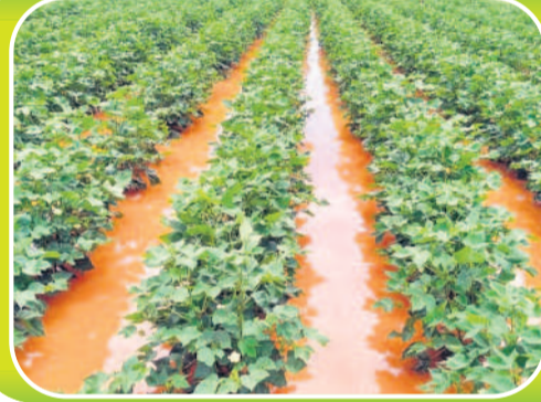
అయిజ మండలం సంకాపురం శివారులో పత్తి పంటలో చేరిన వర్షపు నీరు ముక్త మండలంలో నీటి మునిగిన కంది పంట