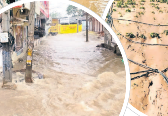
జడ్చర్లలో వెంకటరమణ థియేటర్ కు వెళ్లే దారిలో డ్రైనేజీ నిండి రోడ్డుపై పారుతున్న వర్షపునీరు