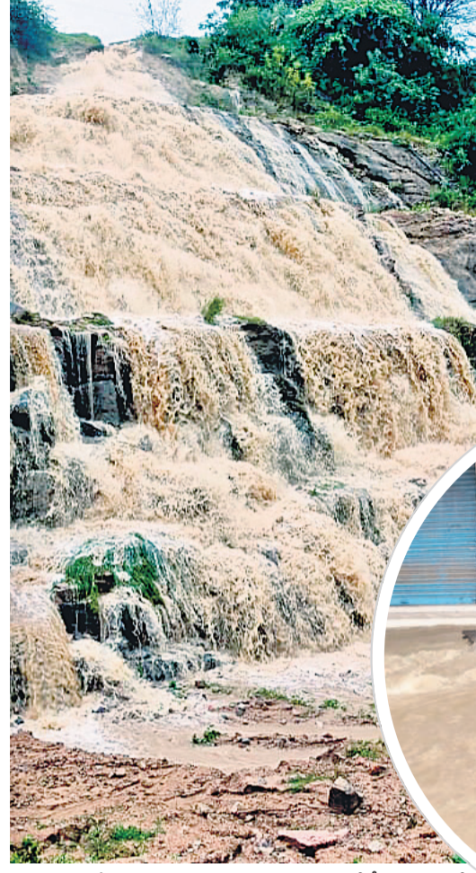
తిమ్మాజిపేట మండలం గుమ్మకొండ సమీపంలో పీఆర్ఎల్ఐలో భాగంగా తప్పిద ప్రధాన కార్యాలయ కార్యకర్తలను వర్షపునీరు