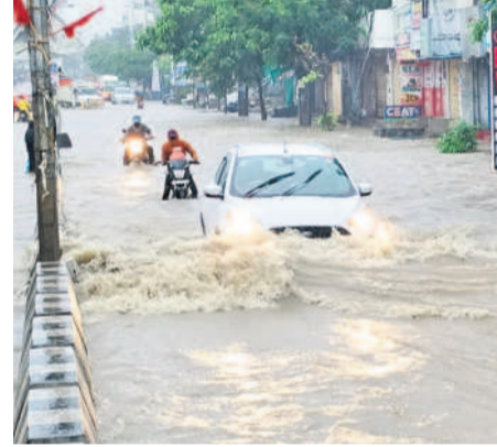
జడ్చర్లలోని ప్రధాన రహదారిపై నిలిచిన వర్షపునీటిలో వెళ్తున్న వాహనదారులు

పోలీసులు రాకపోకలను నిలిపివేయించారు. దీంతో 6 గంటల పాటు ప్రయాణికులకు నిరీక్షణ తప్పలేదు. అయిజలోని లోతట్టు కాలనీలు జలమయమయ్యాయి. పంట పొలాలు నీటి మునిగాయి. కంది, పత్తి, పరి దెబ్బతినడంతో రైతులు అందోళన చెందారు. అయిజలో రాష్ట్రంలోనే అత్యధికంగా 133.3 మి.మీ. వర్షపాతం నమోదైంది. 14 ఏండ్లలో ఎప్పుడూ ఇంత వర్షం కురవలేదని అయిజ మండల రైతులు పేర్కొన్నారు. అయిజ పీహెచ్ఎస్ అవరణ నీటితో చెరువును తలపించింది. దశాబ్దాల వచ్చేందుకు రోగులు, సిబ్బంది తీవ్ర ఇక్కట్లు పడ్డారు. మల్లకల్ మండలం చర్లగూడెంపాడు ప్రాథమిక పాఠశాల ఆవరణలో నీరు నిలవడంతో విద్యార్థులు, ఉపాధ్యాయులు అలాగే వెళ్లారు. అలాగే జడ్చర్ల మండలంలో భారీవర్షం కురిసింది. స్థానిక డ్రైనేజీలు పొంగిపొరాయి. రోడ్డుకి నీరు చేరడంతో రాకపోకలకు ఇబ్బందులు తలెత్తాయి. పాతబజార్, పెద్దగుట్ట, పద్మావతీ కాలనీ, తాలూకా క్లబ్ ప్రాంతంలోని నీళ్లు నీళ్లు కుంటున్న వద్ద కాలనీకి రావడంతో పొంగింది. దీంతో జడ్చర్ల-నాగర్ కర్నూల్ ప్రధాన రహదారిపైకి చేరడంతో సమస్యలు తీవ్రపడతాయి. అలాగే స్థానిక ప్రభుత్వ వంద పడకల దశాబ్దాల ఆవరణను వర్షపునీరు ముంచేత్తింది.