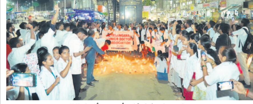
కొవ్వోతులతో శాంతిర్యాలి నిరవహిస్తున్న వైద్యవిద్యార్థులు