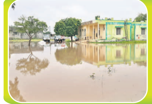
వర్షపునీరు చేరడంతో చెరువును తలపిస్తున్న అయిజ పీహెచ్ఎస్