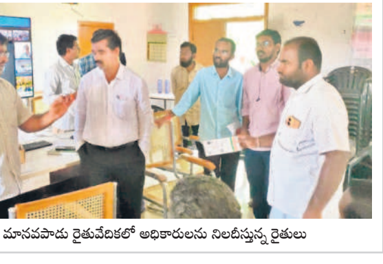
మానవహేతు రైతువేదికలో అధికారులను నిలదీస్తున్న రైతులు

యానాయక్, ఏకాదో సుబ్బారెడ్డి జరగడం. అధికారులు వస్తున్నారన్న విషయం తెలుసుకొన్న రుణమాఫీ కాని రైతులు భారీగా అడ్డంకు చేరుతున్నారు. కాంగ్రెస్ అధికారంలోకి వచ్చాక రూ.2 లక్షల రుణమాఫీ చేస్తామని ప్రకటించి.. మూడు విడుదల నేడు కొర్రలు పెడుతూ అందరికీ అందించడం లేదని ద్వేషిస్తున్నారు. రూ.20 వేల నుంచి రూ.2 లక్షల రుణం ఉన్న రైతులు వారి మందిరికీ మాఫీ కాలేదని వాపోయారు. దీంతో రైతులు బ్యాంకులు, రెవెన్యూ కార్యాలయాల చుట్టూ ప్రదక్షిణలు చేస్తున్నారని ద్వేషిస్తున్నారు. అను మాఫీ అవుతుందా..? అని ప్రశ్నించారు. దీనికి అధికారులు మాత్రం తెలియదని, మాఫీ కాని రైతుల వివరాలు సేకరిస్తున్నట్లు చెప్పి చేతులు దులుపుకోన్నారు.