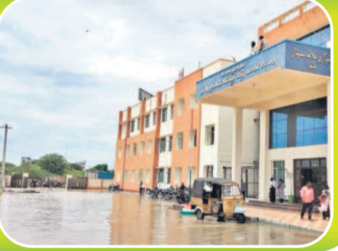
జడ్చర్ల వంద పడకల దశాబ్దాల ఆవరణలో నిలిచిన నీళ్లు