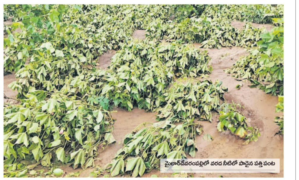
మైలారదేవరంపల్లిలో వరద నీటిలో పాడైన పత్తి పంట