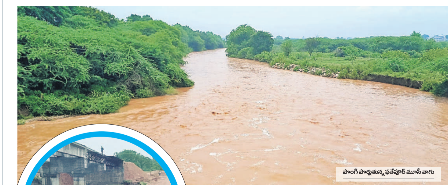
పాంగి పార్కును ఫతేపూర్ మునీ వారు