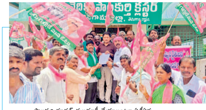
పాలకల్లో రూరల్: రుణమాఫీ చేయాలంటూ ఏడీపీకు వినతి పత్రం అందజేస్తున్న బీఆర్ఎస్ శ్రేణులు

జనగామ, ఆగస్టు 20 (నమస్తే తెలంగాణ) : ఎన్నికల ముందు కాంగ్రెస్ పార్టీ ఇచ్చిన హామీ మేరకు 2014 నుంచి 2023 వరకు రూ.2 లక్షల పుంజు రుణాలను మాఫీ చేసి వెంటనే కొత్త రుణాలివ్వాలని తెలంగాణ రైతు సంఘం జిల్లా కమిటీ డిమాండ్ చేసింది. మంగళవారం జనగామ సమీప కలెక్టరేట్ కార్యాలయం ఎదుట రైతులతో కలిసి