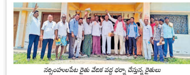
నర్సంపాలపేట రైతు వేదిక వద్ద ధర్నా చేస్తున్న రైతులు

సంగం, ఆగస్టు 20 : రుణమాఫీ కోరేదని కాపులకనపల్లి సొసైటీ పరిధిలోని రైతులు మంగళవారం సంగం మండలం గవిపల్లెలోని వరంగల్ - నెక్సోడ్ ప్రధాన రోడ్డులో రాస్తారోకో చేశారు. సొసైటీలో 1907 మంది రుణాలు తీసుకుంటే మూడు విడతల్లో ఏ ఒక్కరికీ మాఫీ కాదని నిరసన తెలిపారు. అర్జున రైతులందరికీ ప్రభుత్వం రుణమాఫీ వర్తింప జేయాలని వారు డిమాండ్ చేశారు. పార్టీలక