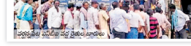
వడ్లన్నపేట వినోదీ వద్ద రైతుల భారాలు

తీతంగా ఏకమై రోడ్లెక్కి ప్రభుత్వానికి, అధికారి కులు, పాలకమండలికి వ్యతిరేకంగా నినాదాలు చేశారు. సంగం మండలంలోని వివిధ బ్యాంకుల్లో పంట రుణాలు తీసుకున్న రైతులకు రుణమాఫీ వర్తిస్తే కాపులకనపల్లి, చింతలపల్లి సొసైటీలో తీసుకున్న ఏ రైతుకూ మాఫీ వర్తింపజేయవలం అనార్యమని మండిపడ్డారు. తక్షణమే రుణమాఫీ చేయకపోతే ఆంధ్రోశనలు ఉధృతం చేస్తామని హెచ్చరించారు.