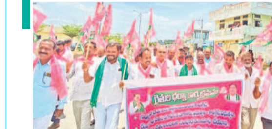
పాలకల్లో ధర్నా చేస్తున్న బీఆర్ఎస్ నాయకులు, కార్యకర్తలు