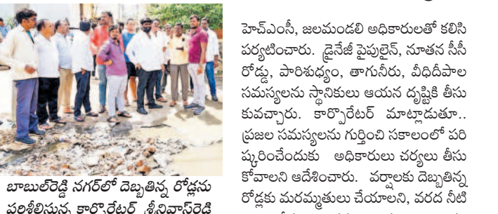
మాళిక సదుపాయాల కల్పనకు కృషి

మాళిక సదుపాయాల కల్పనకు కృషి. మాళిక సదుపాయాల కల్పనకు కృషి. మాళిక సదుపాయాల కల్పనకు కృషి.