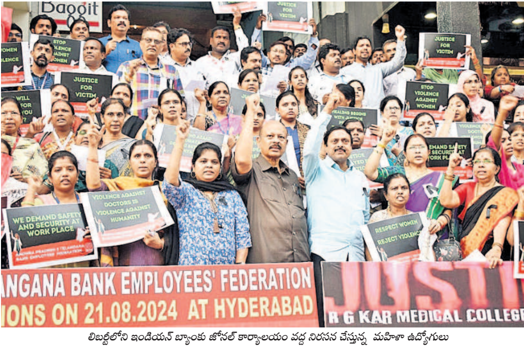
విద్యురాలి హత్యకు నిరసనగా శంషాబాద్ పట్టణంలో డాక్టర్లు ధర్నా చేస్తున్న మహిళలు