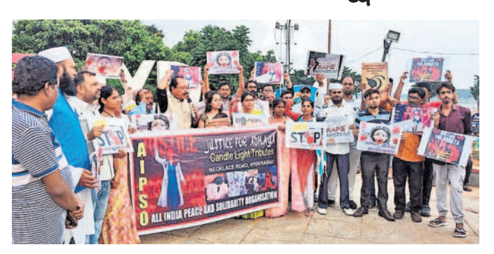
విద్యురాలి హత్యకు నిరసనగా శంషాబాద్ పట్టణంలో డాక్టర్లు ధర్నా చేస్తున్న మహిళలు

విద్యురాలి హత్యకు నిరసనగా శంషాబాద్ పట్టణంలో డాక్టర్లు ధర్నా చేస్తున్న మహిళలు. విద్యురాలి హత్యకు నిరసనగా శంషాబాద్ పట్టణంలో డాక్టర్లు ధర్నా చేస్తున్న మహిళలు. విద్యురాలి హత్యకు నిరసనగా శంషాబాద్ పట్టణంలో డాక్టర్లు ధర్నా చేస్తున్న మహిళలు.