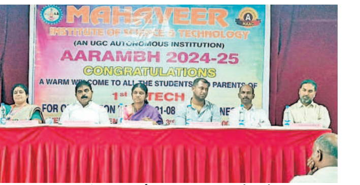
ఉన్నత శిఖరాలను అధిరోహించాలి

ఉన్నత శిఖరాలను అధిరోహించాలి. ఉన్నత శిఖరాలను అధిరోహించాలి. ఉన్నత శిఖరాలను అధిరోహించాలి.