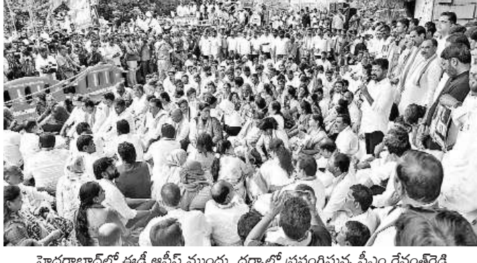
హైదరాబాద్ లో ఈడీ ఆఫీస్ ముందు ధర్నాలో ప్రసంగిస్తున్న సీఎం రేవంత్ రెడ్డి

హైదరాబాద్, ఆగస్టు 22 (నమస్తే తెలంగాణ): అటు చూస్తే కాంగ్రెస్ అధిష్టానం అదే.. ఇటు చూస్తే అదానీతో పాఠశాలకు స్నేహం.. అటు ఖర్చేను, రాహుల్ గాంధీని కాదనలేక, ఇటు అదానీని అనలేక సీఎం రేవంత్ రెడ్డి సభకు తమయ్యారు. హైదరాబాద్ లో గురువారం ఈడీ ఆఫీస్ ముందు జరిగిన ధర్నాలో సీఎం ప్రసంగాన్ని చూస్తే ఇది అర్థం అవుతుంది. అదానీ కుంభకోణంపై విచారణ జరపాలని, సెబీ చైర్పర్సన్ అక్రమాల్పై సీఎం రేవంత్ రెడ్డి కమిటీ (జేబీపీ) వేయాలన్న డిమాండ్ లోపే అదానీని విమర్శించారు. ఈ కార్యక్రమానికి మొక్కుబడిగా వేయాలన్న డిమాండ్ లోపే అదానీని విమర్శించారు. ఈ కార్యక్రమానికి మొక్కుబడిగా వేయాలన్న డిమాండ్ లోపే అదానీని విమర్శించారు. ఈ కార్యక్రమానికి మొక్కుబడిగా వేయాలన్న డిమాండ్ లోపే అదానీని విమర్శించారు.