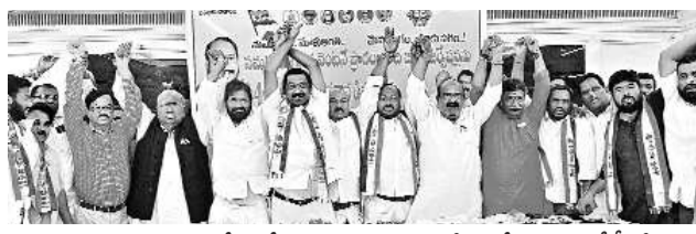
హైదరాబాద్ సెంట్రల్ కోర్టులో నిర్వహించిన సమావేశంలో పాల్గొన్న బీసీ నేతలు