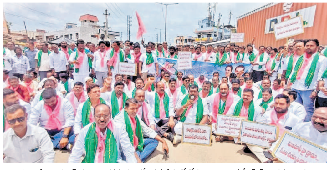
నంగారెడ్డి జిల్లా పటాన్చెరు నియోజకవర్గం పరిధిలోని గుమ్మడిదలలో రోడ్డుపై బైరాయింబిన బీఆర్ఎస్ నాయకులు, రైతులు