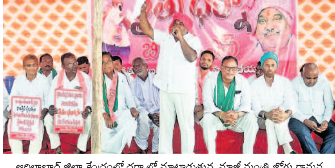
ఆదిలాబాద్ జిల్లా కేంద్రంలో ధర్నాలో మాట్లాడుతున్న మాజీ మంత్రి జోగు రామన్న