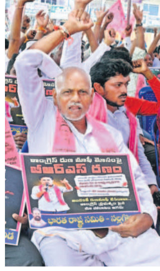
నల్లగొండ జిల్లా కేంద్రంలో జరిగిన ధర్నా జిబిరంలో పాల్గొనడం, విడికికెత్తి నిరసన వ్యక్తం చేస్తున్న రైతులు