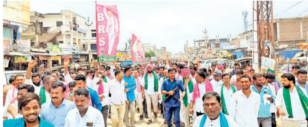
అదిలాబాద్ జిల్లా ఇచ్ఛోడలో బోధ్ ఎమ్మెల్యే అనిల్జాదవ్ నేతృత్వంలో భారీ ర్యాలీ తీస్తున్న బీఆర్ఎస్ శ్రేణులు, రైతులు