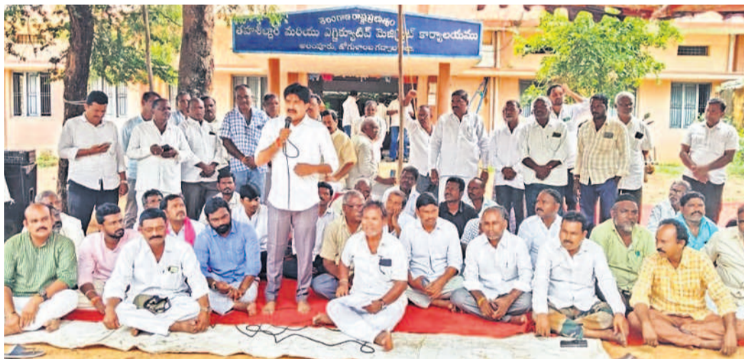
కోగుళాం జిల్లా అలంపూర్ తహసీల్ కార్యాలయం వద్ద ధర్నాలో మాట్లాడుతున్న ఎమ్మెల్యే విజయదు