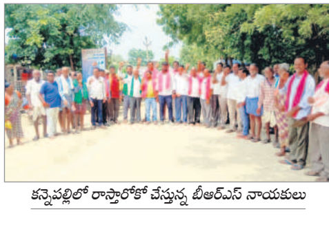
కన్నెపల్లిలో రాస్ట్రాలోకో చేస్తున్న బీఆర్ఎస్ నాయకులు