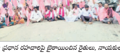
జైపూర్ : ప్రధాన రహదారిపై ధర్మాచేసిన రైతులు, నాయకులు