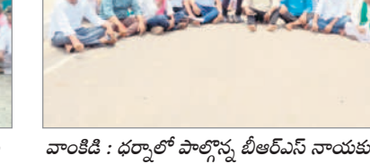
వాంకిడి : ధర్మాలో పాల్గొన్న బీఆర్ఎస్ నాయకులు, కార్యకర్తలు