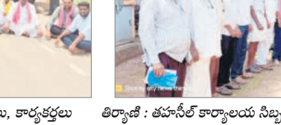
తిర్యాల : తహసీల్ కార్యాలయం నిర్బంధికి వినతిపత్రం ఇస్తున్న నాయకులు