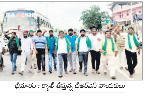
భీమారం : రా్య్ టీస్తున్న బీఆర్ఎస్ నాయకులు