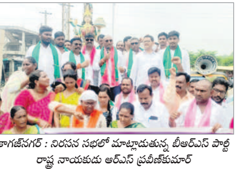
కాగజీనగర్ : నిరసన సభలో మాట్లాడుతున్న బీఆర్ఎస్ పార్టీ రాష్ట్ర నాయకుడు ఆర్ఎన్ ప్రవీణ్ కుమార్