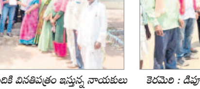
కెరమెల : డిప్యూటీ తహసీల్దార్ కు వినతిపత్రం ఇస్తున్న నాయకులు