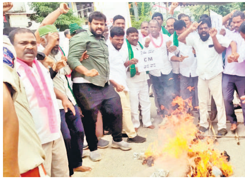
జడ్పీలలో ముఖ్యమంత్రి రేవంత్ రెడ్డి దిష్టిబోమ్మను దహనం చేస్తున్న బీఆర్ఎస్ నాయకులు, కార్యకర్తలు

బీనెట్ రూ.81వేలు అని, బడ్జెట్ కేటాయింపుకాకే సరికి రూ.7.500కోట్లు అంటూ రైతులను నిండా ముంచారన్నారు. సీఎం, మంత్రులు ఒక్కొక్కరు ఒక్కొక్కలా మాట్లాడుతూ ప్రజలను తప్పుదోవ పట్టిస్తున్నారనీ మం డిపడ్డారు. అన్నదాతలు ఎంతో నిజాయితీ, ధృత్యాత్ములు నీ.. అటువంటివారు కాంగ్రెస్ మోసపూరిత మాలలు, వ్యాజ్యాలను నమ్మి 'పాలివేసి బర్రెను బిడివిట్టి' దున్ను పోతుంటే ప్రభుత్వాన్ని కొట్టేసేటట్లు ముచ్చాకునారనీ ఆవేదన వ్యక్తం చేశారు. ప్రాణాలకు తెగించి తెచ్చుకున్న తెలంగాణ.. కేసీఆర్ పాలనలో అన్నదాతల్లో అద్దం పత్రం ప్రతి పాదింపించినారన్నారు. ఏడాది కూడా కాకమందే ప్రజలను కాంగ్రెస్ ముప్పాటివలు పెడుతూ సంక్షేమ పథకాలన్నవనీ నట్టేట ముంచిందనీ మండిపడ్డారు. 70-80 శాతం పూర్వయన ప్రాజెక్టులను సైకిల కాంగ్రెస్ పట్టించుకోకుండా బుర్రకడలేలా విమర్శలు చేస్తుండ