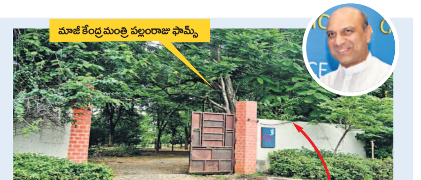
మాజీ కేంద్ర మంత్రి పల్లంరాజు ఫామ్స్

టీవల హైద్రా కూల్చివేసిన నిర్మాణం ఇది. గండిపేట జలాశయం ఎఫ్టీఎల్ పరిధిలో ఉన్నందున కూల్చినా తప్పని హైద్రా స్ట్రక్చరల్ ఇంజనీర్ మరీ... దానిని అనుకునే మరో నిర్మాణం ఉంది. అది ఎఫ్టీఎల్ పరిధిలోకి రాదా? అనేది సామాన్యుడి సందేహం. ఒకవేళ కూల్చివేయని నిర్మాణం పక్కనుంచే ఎఫ్టీఎల్ గీత వెళ్లిందనే సాకు చూపే అవకాశాలు ఉండొచ్చు. అదే నిజమైతే... ఎఫ్టీఎల్ ను అనుకొని వంద ఫీట్ల వరకు బఫర్ జోన్ ఉంటుంది. బఫర్ జోన్ ను కాపాడాల్సింది కూడా అదే హైద్రా కదా! కానీ ప్రత్యేకంగా ఓ నిర్మాణాన్ని కూల్చడం.. మరో నిర్మాణాన్ని కూల్చకుండా వదిలేయడం అనేది ప్రస్తుతం చర్చనీయాంశంగా మారింది.