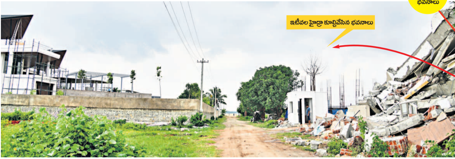
ఇటీవల హైద్రా కూల్చిన భవనాలు