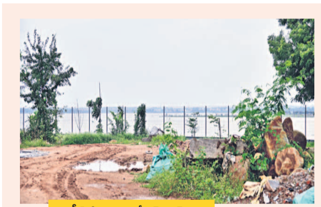
గ్రీన్ కో గ్రూపు ఎండ్ గెస్ట్ హౌస్ ఇది

గండిపేట జలాశయం ఎఫ్టీఎల్ పరిధిలో ఉందంటూ... తన పరిధిని దాటుకొని పోయి హైద్రా కూల్చివేసిన మూడు బహుళ అంతస్తుల నిర్మాణాలు ఇవే. ఈ కూల్చివేతలతోనే హైద్రా అడుగులపై అనుమానాలు వెల్లువెత్తుతున్నాయి. అప్పటికి రింగ్ రోడ్డు వరకు మాత్రమే హైద్రా పరిధి అని జీవో నెంబరు 99లో స్పష్టంగా ఉన్నప్పటికీ... అప్పటికి దాటి 15 కిలోమీటర్ల దూరంలోని ఆప్రోజిగూడలో ఉన్న ఈ నిర్మాణాలను హైద్రా యంత్రాంగం భారీ క్రేన్లు, పాల్లెయిన్లతో పచ్చి నేల మట్టం చేసింది. హైద్రా జీవోలో ఎక్స్టెండ్డ్ యూఎల్ డి, జీపీ జాబితాలో కూడా ఆప్రోజిగూడ లేదు. నోటీసులు ఇవ్వడం మాలు దేవుడెవరు... కనీసం అందులో ఉన్న ఫర్మర్, ఇతర సామగ్రిని తీసుకునేందుకు కూడా సమయం ఇవ్వకుండా