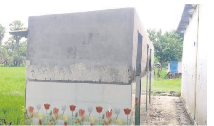
కొత్తగా రేకులు వేసిన మరుగుదొడ్డు ఇవే..

దాడులతో కలకలం రాష్ట్రవ్యాప్తంగా దేవాలయాల్లో తిష్ట వేసి, అవినీతి అక్రమాలకు పాల్పడటం న్యూరస్ ప్రభుత్వం ఇటీవలే భారీ ఎత్తున ఉద్ధోగ బదిలీలు చేపట్టింది. అయితే, వేములవాడ, యాదగిరిగుట్ట నుంచి అత్యధిక సంఖ్యలో ఉద్ధోగలు బదిలీ అయ్యాయి. అయినప్పటికీ విజిలెన్స్, ఇతర ఆరోపణలు ఉన్నవారు మాత్రం బదిలీ కాలేదు. ఈ నేపథ్యంలోనే ఫిర్యాదులు వెల్లువెత్తడం, మొదటి విజిలెన్స్ అధికారులు ఆ తర్వాత ఏసీబీ దాడులు చేయడం కలకలం రేపుతున్నది. ఈ వ్యవహారంలో పేదల దేవుడు రాజన్నకు మన్నన పడేనా? అనే ఆందోళన భక్తుల్లో కనిపిస్తుండగా, దాడులపై జోరుగా చర్య సాగుతున్నది.