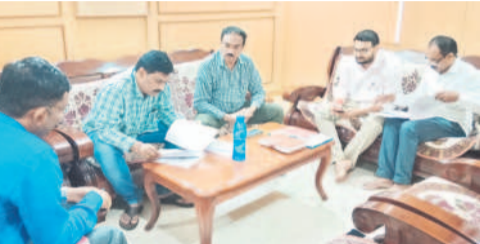
వేములవాడ రాజన్న ఆలయంలో రెండో రోజు రికార్డులను పరిశీలిస్తున్న ఏసీబీ అధికారులు