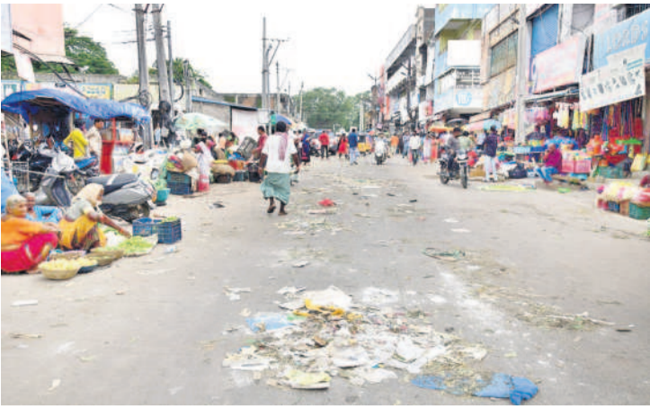
నిత్యం వేలాది మంది తిరిగి కరీంనగర్ మార్కెట్ రోడ్డు చెత్తమయంగా మారింది. కూరగాయల వ్యర్థాలు, కవచ్చు, ఇతర చెత్తంతా నడి రోడ్డుపైనే పడిస్తుండడంతో ఇలా కుప్పలు కుప్పలుగా పేరుకు పోతున్నది. దీంతో వాహనదారులు రాకపోకలు సాగించేందుకు అవస్థలు పడాలి వస్తున్నది.

మార్కెట్ రోడ్డు మధ్యలోనే పేరుకుపోతున్న చెత్త