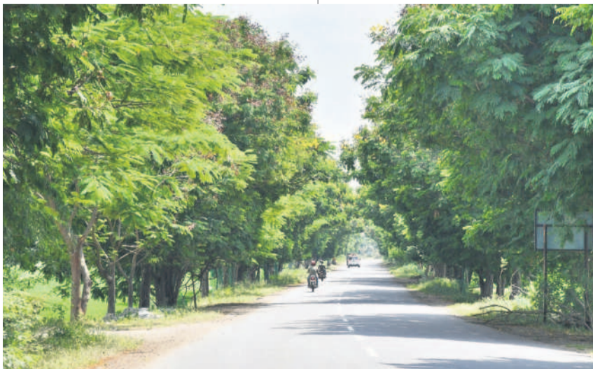
వింతలంట-మల్కాపూర్ బైపాస్ రోడ్డులో 4వ విడుదల హరితవహారం నాటిన్ మొక్కలు నేడు మానులుగా మారిన దృశ్యం

కరీంనగర్ కలెక్టరేట్, ఆగస్టు 23 : తెలంగాణ తొలి ముఖ్యమంత్రి కేసీఆర్ తీసుకువచ్చిన హరితవహారం సత్యతాలనిచ్చింది. అప్పటి బీఆర్ఎస్ ప్రభుత్వం ఈ కార్యక్రమాన్ని ఒక యజ్ఞంగా కొనసాగించింది. ఏటా వానకాలం చివరపాలే వర్షాలు పడగానే.. మొక్కలు నాటింది. అనంతరం అసంక్షణ చర్యలను అధికార యంత్రాంగం చూసుకునేది. దీంతో నాటిన్ మొక్కల్లో అత్యధిక శాతం వృక్షాలుగా మారాయి. కరీంనగర్ జిల్లాలో తొమ్మిది విధులతో 4.2 కోట్ల పైచిలుకు మొక్కలు నాటగా, ప్రస్తుతం 3.5 కోట్లపైకాగా బతికి ఏపూగా పెరిగాయి.