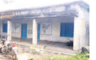
పోచంపల్లి ప్రాథమిక పాఠశాల

కాల్యక్తిరాంపూర్, ఆగస్టు 23 : బిల్లుల కోసం పాఠశాల బడికి పూతలు పెడుతున్నారు. అమ్మ ఆదర్శ పాఠశాల అభివృద్ధి పథకం కింద పెద్దముత్తలో నిధులు మంజూరు కాగా, నాలుగొండ్ల క్రితం మూతపడిన స్కూల్ కు మరమ్మతులు చేస్తున్నారు. బిల్లులు లేకుండా పనులు చేయడంపై తల్లిదండ్రులు మండిపడుతున్నారు. ఇదంతా కమీషన్ల కోసంనే చేస్తున్నారనే ఆరోపణలు వస్తున్నాయి. కాల్యక్తిరాంపూర్ మండలంలోని మీర్జాపేట పరిధిలోని పోచంపల్లి గ్రామం నుంచి కేసుల 14 మంది విద్యార్థులే ఉన్నారు. అందులో 12 మంది వైవేటీ స్కూల్లో చేరారు. విద్యార్థులు అనుకున్న స్థాయిలో లేకపోవడంతో స్థానిక ప్రాథమిక పాఠశాలను నాలుగేళ్ల క్రితం మూసివేశారు. అందులో ఉన్న ఇద్దరు పిల్లలను పక్కనే మీర్జాపేట స్కూల్లో చేర్చారు. అయితే ప్రభుత్వం అమ్మ ఆదర్శ పాఠశాల అభివృద్ధి పథకం సూక్ష్మ మరమ్మతులు చేపట్టింది. అందుకు మండలంలోని 38 స్కూళ్లకు ₹ 1.70 కోట్ల మంజూరు చేసింది. అందులో పోచంపల్లి స్కూల్ కు 8.40 లక్షలు కేటాయించింది. దీంతో మూతపడిన పోచంపల్లి పాఠశాలను అభివృద్ధి చేస్తున్నారు. ఈ నిధులతో పంట గడి, మరుగుదొడ్డు నిర్మిస్తున్నారు. కేవలం మరుగుదొడ్డుకు పైకప్పు వేయించి, సుమారు