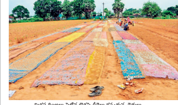
మిరప గింజలు పెట్టిన బెడ్లపై చీరలు కప్పేస్తున్న రైతులు