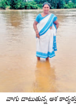
వాగు దాటుతున్న ఆశ కార్యక్రమం

వారం తెల్లవారజామున వర్రం కురవడంతో వాగులో వరద ఎక్కువ ఉన్నప్పటికీ డ్యూటీ చేయాలనే పట్టు దుమ్మం ముందుకువెళ్లడాన్ని పలువురు అభినందించారు.