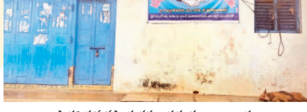
ప్రాథమిక వ్యవసాయ సహకార సంఘం కార్యాలయం

■ గుండ్రాతి మడుగులో 35.88 శాతం మందికి మాఫీ ■ మరో 243 మంది రైతుల ఎదురు చూపులు