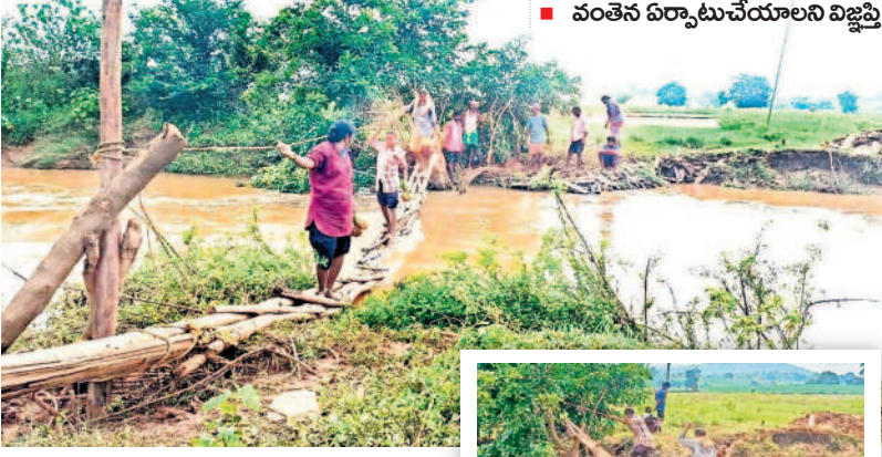
కర్రల వంతెనపై పెద్దవాగు దాటుతున్న రైతులు, వ్యవసాయ కూలీలు