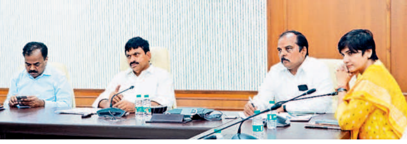
వరంగల్ నగర మ్యూన్సిపాలిటీ సమీక్ష నిర్వహిస్తున్న ఉమ్మడి జిల్లా ఇన్‌చార్జి మంత్రి పొంగలలేటి శ్రీనివాస్ రెడ్డి