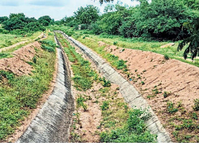
ఎండిపోయిన జనగామ మండలం ఎర్రగొల్లపహాడ్- మలగడి గ్రామాలకు నీళ్లు తీసుకెళ్లే కాల్వ

గోదావరి జలాలను కాల్వల ద్వారా గ్రామాల్లోని చెరువులకు విడుదల చేస్తే పొలాలు దున్నకొని నాట్లు వేసుకుంటున్న రైతులు వేడుకుంటున్నారు. రిజర్వాయర్లో పుష్పలంగా నీళ్లు ఉన్నా ఎందుకు విడుదల చేస్తేలో అర్థం కావడం లేదని వాపోతున్నారు. - జనగామ రూరల్, ఆగస్టు 24