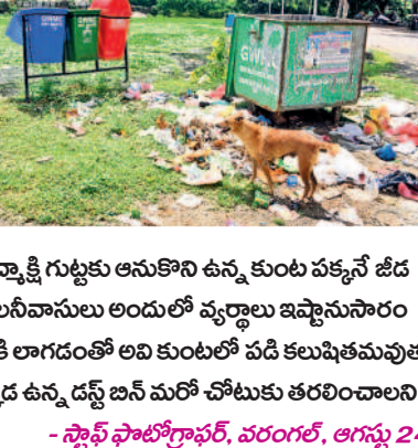
-స్టాఫ్ ఫోటోగ్రాఫర్, వరంగల్, ఆగస్టు 24

చుట్టూ కొండలు, పచ్చని మొక్కలతో నిజమే నడుమ ఉన్న 'బతుకమ్మ తల్లి' ప్రతిమ.. చూసేందుకు ఎంత ఆసక్తిగా ఉంటే అనుకుంటున్నారా? కానీ కాదు. అక్కడ కనిపించే పచ్చదనం వెనుక కుంటంతా నాడే అన్నట్లు ఆశ్చర్యమిచ్చిన గుర్రపు డెక్కా వ్యర్థాలు, దుర్బంధమే ఉన్నాయి. హనుమకొండ పద్మాక్షి గుట్టకు ఆనుకొని ఉన్న కుంట పక్కనే జీద బ్లాక్ నుంచి చెత్త కుంటే ఏర్పాటుచేసిన సమీప కాలనీవాసులు అందులో వ్యర్థాలు ఇవ్వాలని వేయడం, కుక్కలు ఆహారం కోసం వాటిని బయటికి లాగడంతో అవి కుంటలో పడి కలుషితమవుతున్నది. కుంట నుంచి గుర్రపుడెక్కను తొలగించి అక్కడ ఉన్న డబ్బు బస్ మరో చోటుకు తరలించాలని స్థానికులు కోరుతున్నారు.