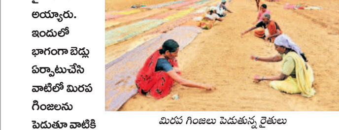
మిరప గింజలు పెడుతున్న రైతులు

రక్తగా చీరలనుమహిళా రైతులు, కూలీలు కప్పతున్న తీరు ఆకట్టుకుంటున్నది. నేలను పరుచుకున్న తీరొక్కరంగుల చీరలతో భూమికి రంగులేసినట్లున్న ఈ ధృత్యం జయశంకర్ భూపాలపల్లి జిల్లా మహాదేవపూర్ మండలం సూరారం గ్రామ శివారులో 'నమస్తే' కెమెరాకు చిక్కింది.