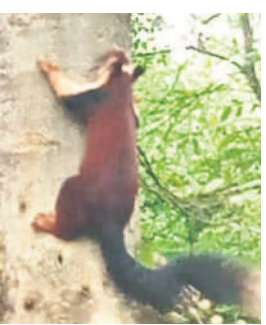
అటవీ ప్రాంతంలో కనిపించిన అరుదైన ఉడుత