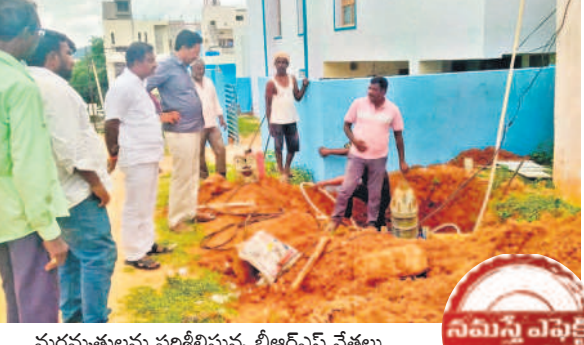
మరమ్మత్తులను పరిశీలిస్తూ బీఆర్ఎస్ నేతలు

వనవల్లి, ఆగస్టు 24 (నమస్తే తెలంగాణ) : ఐదు రోజులుగా మిషన్ భగీరథ నీటి సరఫరా నిలిచిన క్రమంలో శనివారం యథావిధిగా విడుదల పున:ప్రారంభమైంది. భగీరథ సైపులైన్ పై వాల్స్ ను ఏర్పాటు చేసే క్రమంలో నీటి సరఫరా నిలిచిపోయింది. దీంతో గ్రామాల్లో తాగునీటి ఎద్దడి ఏర్పడింది. దీనిపై 'నమస్తే తెలంగాణ'లో 'భగీరథ నీళ్లు బంద్' కథనం ప్రచురితమైంది. సమస్యపై మిషన్ భగీరథ ఎన్ఈ వెంటకరమణ స్పందించారు. వాల్స్ పనుల వల్ల కొంత అంతరాయం ఏర్పడిందని, శుక్రవారం పొద్దుపోయా పనులను పూర్తి చేసినట్లు వెల్లడించారు. ఈ వాల్స్ ఏర్పాటుతో భవిష్యత్లో జిల్లాలో నీటి సరఫరాలో అంతరాయం ఏర్పడదన్నారు. అలాగే అనారోగ్య సమస్యలు తవ్వకుండా