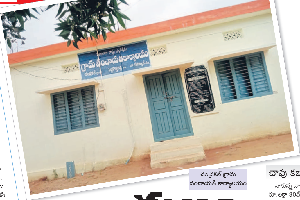
చంద్రకల్ గ్రామ పంచాయితీ కార్యాలయం