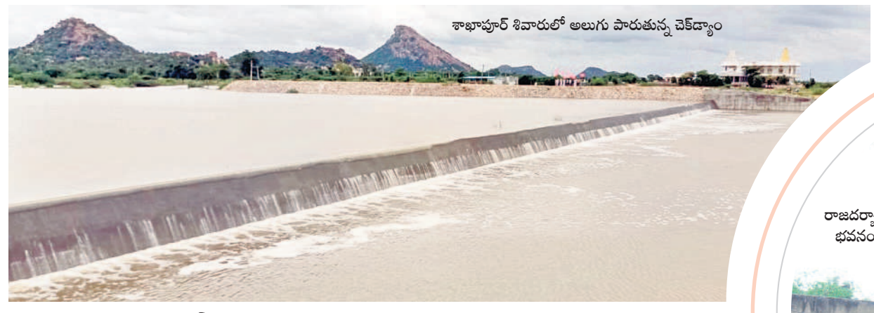
శాఖాపూర్ శివారులో అలుగు పారుతున్న చెక్ డ్యాం