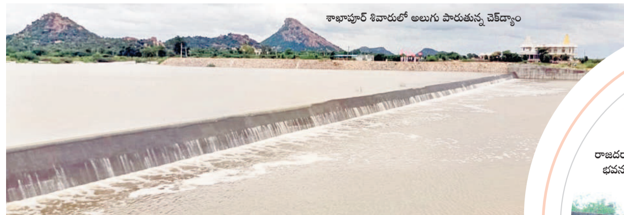
శాఖాపూర్ శివారులో అలుగు పారుతున్న చెక్ డ్యాం