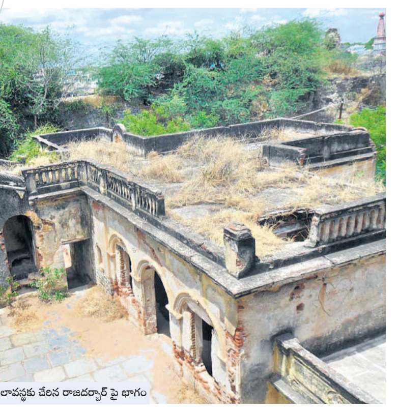
శిథిలావస్థకు చేరిన రాజదర్బార్ పై భాగం