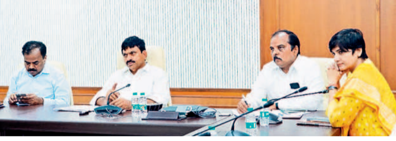
వరంగల్ నగర మ్యూన్సిపాలిటీ సమీక్ష నిర్వహిస్తున్న ఉమ్మడి జిల్లా ఇన్చార్జి మంత్రి పొంగలలేటి శ్రీనివాస్రెడ్డి