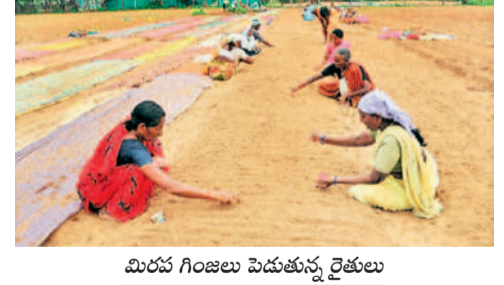
మిరప గింజలు పెడుతున్న రైతులు

సాగు పనుల్లో రైతులు బజ్జీ అయ్యారు. ఇందులో భాగంగా బెడ్డు ఏర్పాటుచేసి వాటిలో మిరప గింజలును పెడుతూ వాటికి