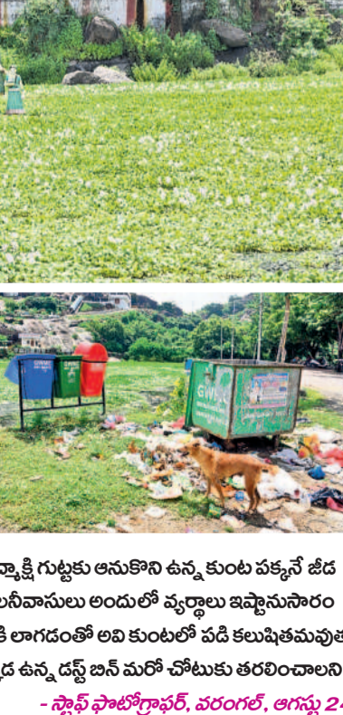
-స్టాఫ్ ఫోటోగ్రాఫర్, వరంగల్, ఆగస్టు 24

చుట్టూ కొండలు, పచ్చని మొక్కలతో నిజమే నదును ఉన్న 'బతుకమ్మ తల్లి' ప్రతిమ.. చూసేందుకు ఎంత ఆసక్తిగా ఉందో అనుకుంటున్నారా? కానీ కాదు. అక్కడ కనిపించే పచ్చదనం వెనుక కుంటంతా నాడే అన్నట్లు ఆకాశం చేసిన గుర్రపు డెక్కా వ్యర్థాలు, దుర్గంధమే ఉన్నాయి. హనుమకొండ పద్మాక్షి గుట్టకు ఆనుకొని ఉన్న కుంట పక్కనే జీద బ్లాక్ నుంచి చెత్త కుండే ఏర్పాటుచేసిన సమీప కాలనీవాసులు అందులో వ్యర్థాలు ఇవ్వాలని వేయడం, కుక్కలు ఆహారం కోసం వాటిని బయటికి లాగడంతో అవి కుంటలో పడి కలుషితమవుతున్నది. కుంట నుంచి గుర్రపుడెక్కను తొలగించి అక్కడ ఉన్న డబ్బు బస్ మరో చోటుకు తరలించాలని స్థానికులు కోరుతున్నారు.