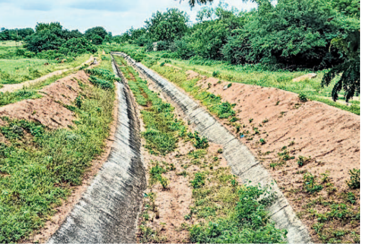
ఎండిపోయిన జనగామ మండలం ఎర్రగొల్లపహాడ్- మలగడి గ్రామాలకు నీళ్లు తీసుకెళ్లే కాల్వ

గోదావరి జలాలను కాల్వల ద్వారా గ్రామాల్లోని చెరువులకు విడుదల చేస్తే పొలాలు దున్నకొని నాట్లు వేసుకుంటున్న రైతులు వేడుకుంటున్నారు. రిజర్వాయర్లో పుష్పలంగా నీళ్లు ఉన్నా ఎందుకు విడుదల చేస్తేలో అర్థం కావడం లేదని వాపోతున్నారు.