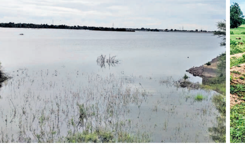
గోదావరి జలాలతో కళకళలాడుతున్న జనగామ మండలంలోని బొమ్మకూర్ రిజర్వాయర్

అసలే కరువు ప్రాంతం.. నీళ్లు లేక అనేక తిప్పలు పడ్డ ఈ ప్రాంతానికి గత కేసీఆర్ సర్కారు గోదావరి జలాలను తీసుకొచ్చి సస్యశ్యామలం చేసింది. కాల్వల ద్వారా గ్రామాల్లోని చెరువులు, కుంటలను నింపింది. గతంలో ఎక్కడహూనినా కోనసీమను తలచిందిన ఈ ప్రాంతం నేడు బీడువారిని పాలాలతో దర్శనమిస్తున్నది. ఈ ప్రాంతంలోని బొమ్మకూర్ రిజర్వాయర్లో నిండుగా గోదావరి జలాలన్నా జనగామ మండలంలోని గ్రామాలు అకు నీరు విడుదల చేయకపోవడంతో రైతుల సాగు పనులు ముందుకు సాగడం లేదు. నీళ్లు లేక పొలాలు దున్నడం లేదు. నీరు అందినా అతికొద్ది మంది రైతులు మాత్రమే నాట్లు వేశారు. ఇప్పటికైనా కాంగ్రెస్ ప్రభుత్వం