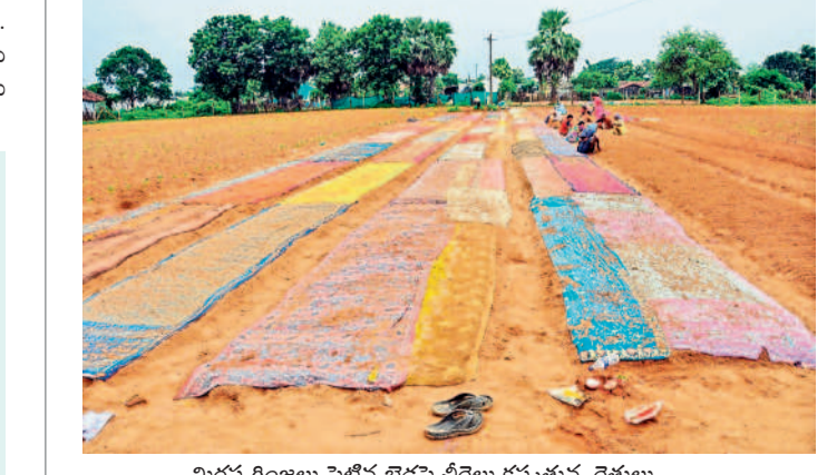
మిరప గింజలు పెట్టిన బెడ్డుపై చీరల కప్పతున్న రైతులు

- ఫోటోగ్రాఫర్, జయశంకర్ భూపాలపల్లి, ఆగస్టు 24