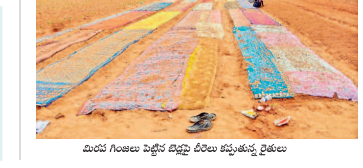
మిరప గింజలు పెట్టిన బెడ్లపై చీరలు కప్పేస్తున్న రైతులు

మా ఊర్లో నా పేరు మీద రెండున్నర ఎకరాల భూమి ఉంది. ఆరేళ్ల క్రితం తీసుకున్న పంట రుణానికి మిల్లి కడుతూ రెన్యూవల్ చేసుకుంటున్నా. గతేడాది కేసీఆర్ ప్రభుత్వ హయాంలో కూడా నాకు రూ. 60 వేలు ఒకేసారి మాఫీ అయ్యింది. ప్రస్తుతం నాకున్న రూ. 37,600 రుణం మాఫీ కాలేదు. ఎందుకు కాలేదని సాన్సెట్ సార్లను అడిగితే పేరు తప్పించినట్లు అధికారులు చెబుతున్నారు. అయితే సంఘంలోని అధికారులు, సిబ్బంది చేసిన తప్పులుగా ఉండే రుణాలు పొందారు. వీరంతా రాష్ట్ర ప్రభుత్వ నిబంధనలకు లోబడి ఉన్నారు. అయితే ప్రభుత్వం