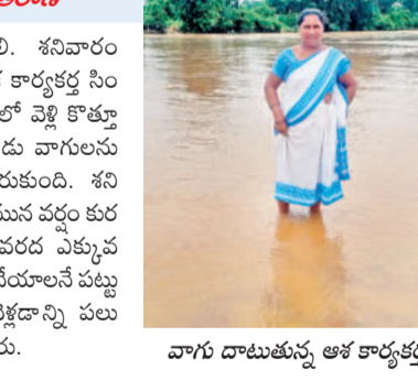
వాగు దాటుతున్న ఆశ కార్యక్రమం

వాగులు దాటి సబ్ సింటర్లకు ఆశ కార్యక్రమం జోరగాలి కన్నాయిగూడెం, ఆగస్టు 24 : డ్యూటీలో ఉండాలి. శనివారం విధి నిర్వహణ కోసం వరదను జోరగాలి ఆనీ ఆశ కార్యక్రమం సైతం లెక్కచేయలేదామె. రెండు వాగులు దాటి సుమారు మూడు కిలోమీటర్లు నడిచి సబ్ సింటర్లకు చేరుకుంది. ములుగు జిల్లా కన్నాయిగూడెం మండలం సర్పంచి సబ్ సింటర్లో ఎనిమిది మంది ఆశ కార్యక్రమం పనిచేస్తున్నారు. ప్రతి రోజు ఒకరు తప్పకుండా అక్కడ