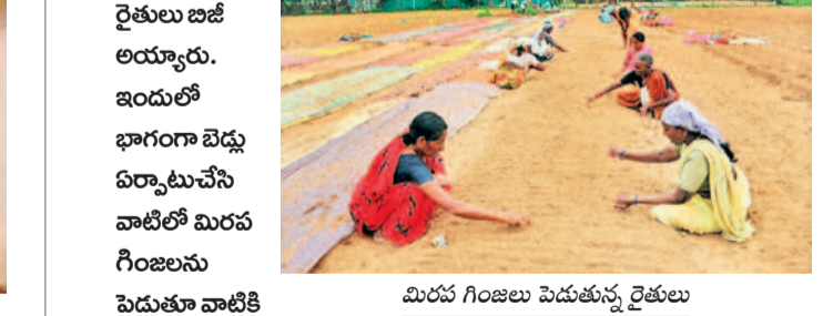
మిరప గింజలు పెడుతున్న రైతులు

రక్షణగా చీరలనుమహిళా రైతులు, కూలీలు కప్పతున్న తీరు ఆకట్టుకుంటున్నది. నేలను పరుచుకున్న తీరొక్కరంగుల చీరలతో భూమికి రంగులేనట్లున్న ఈ ధృత్యం జయశంకర్ భూపాలపల్లి జిల్లా మహాదేవపూర్ మండలం సూరారం గ్రామ శివారులో 'నమస్తే' కెమెరాకు చిక్కింది.