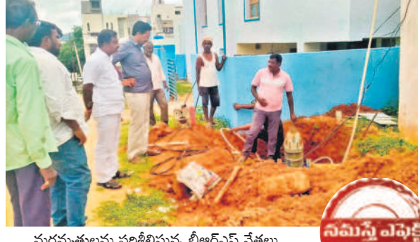
మరమ్మత్తులను పరిశీలిస్తూ బీఆర్ఎస్ నేతలు

వనపర్తి, ఆగస్టు 24 (నమస్తే తెలంగాణ) : ఐదు రోజులుగా మిషన్ భగీరథ నీటి సరఫరా నిలిచిన క్రమంలో శనివారం యథావిధిగా విడుదల పున:ప్రారంభమైంది. భగీరథ సైపులైన్ పై వాల్వ్ ను ఏర్పాటు చేసే క్రమంలో నీటి సరఫరా నిలిచిపోయింది. దీంతో గ్రామాల్లో తాగునీటి ఎద్దడి ఏర్పడింది. దీనిపై 'నమస్తే తెలంగాణ'లో 'భగీరథ నీళ్లు బంద్' కథనం ప్రచురితమైంది. సమస్యను మిషన్ భగీరథ ఎన్ఈ వెంటకరమణ స్పందించారు. వాల్వ్ పనుల వల్ల కొంత అంతరాయం ఏర్పడిందని, శుక్రవారం పొద్దుపోయా పనులను పూర్తి చేసినట్లు వెల్లడించారు. ఈ వాల్వ్ ఏర్పాటుతో భవిష్యత్లో జిల్లాలో నీటి సరఫరాలో అంతరాయం ఏర్పడదన్నారు. అలాగే అనారోగ్య సమస్యలు తవ్వకుండా