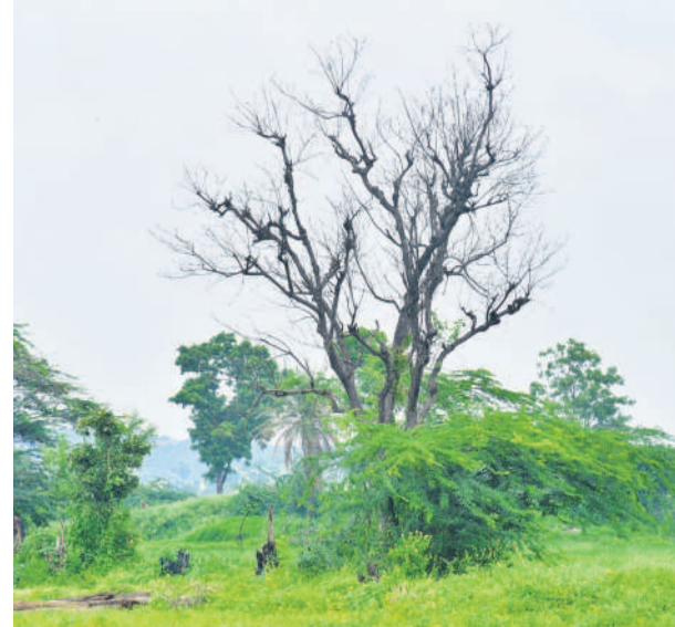
ఓ వైపు వచ్చని చెట్లతో వచ్చడం వెళ్లివిరుస్తూ ఆవృణ్ణకరం వాతావరణం కనిపిస్తుండగా.. మరోవైపు మోడు వాలిన చెట్లు మధ్యలో మలతల అందంతో కనువిందు చేస్తున్నాయి. తరలిరాద తన వసంతం.. తన ద లికిరాని వనాల కోసం 'అన్నట్లు కురుస్తున్న వర్షాలతో చెట్లు మారారు