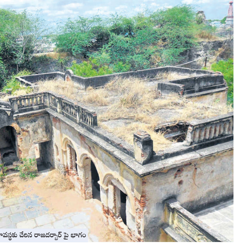
శిథిలావస్థకు చేరిన రాజదర్బార్ పై భాగం