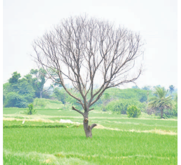
వేయగా.. అలాగే మోడువాలిన చెట్లు సైతం మళ్ళీ చిగురించాలని ఆశిస్తాం.. వనవల్ల జిల్లా పెద్దమండలి మండల కేంద్రం శివారులోని ఈ ధృశ్యాన్ని నమస్తే ఫోటోగ్రాఫర్ తన కెమెరాలో క్లిక్ చేసుకుంటాడు.