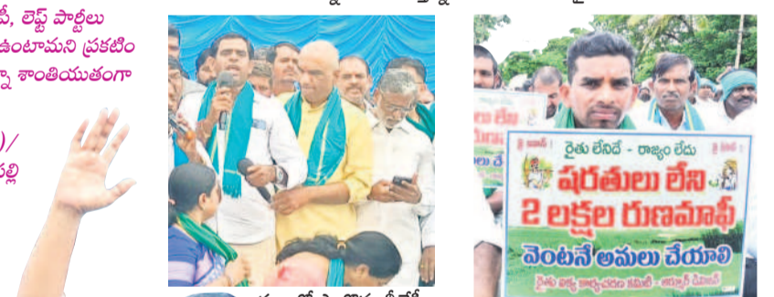
ధర్మాలో పాల్గొన్న బీజేపీ నాయకులు

ఎలాంటి షరతులూ లేకుండా ఏకకాలంలో రూ. 2 లక్షల రుణమాఫీ చేస్తామని హామీ ఇచ్చి గడ్డెత్కిన సీఎం రేవంత్ రెడ్డి.. దారుణంగా మోసం చేశారని అన్నదాతలు ఆగ్రహం వ్యక్తం చేశారు. రైతులతో ఆడుకుంటే ఏమవుతుందో గతంలో చూశారని, ఇచ్చిన మాట ప్రకారం మాఫీ చేయకపోతే రైతుల ఉద్యమం దెబ్బరుచి చూపిస్తామని స్పష్టం చేశారు. ఏ రైతు అయినా మిమ్మల్ని రుణమాఫీ చేయాలని అడిగారా? ముఖ్యమంత్రి పీఠం కోసం మీరే రూ. 2 లక్షల మాఫీ చేస్తామని చెప్పారని విమర్శించారు. రైతులందరికీ రూ. 2 లక్షల రుణమాఫీ చేసే వరకూ పోరాటం ఆగడం సుస్థం చేశారు. సెప్టెంబర్ 15 లోపు సంపూర్ణ రుణమాఫీ చేయాలని గడువు విధించారు. ఆలోచన చేయకపోతే మహాభరణం ఉద్యమాన్ని తలపించేలా పోరాటం