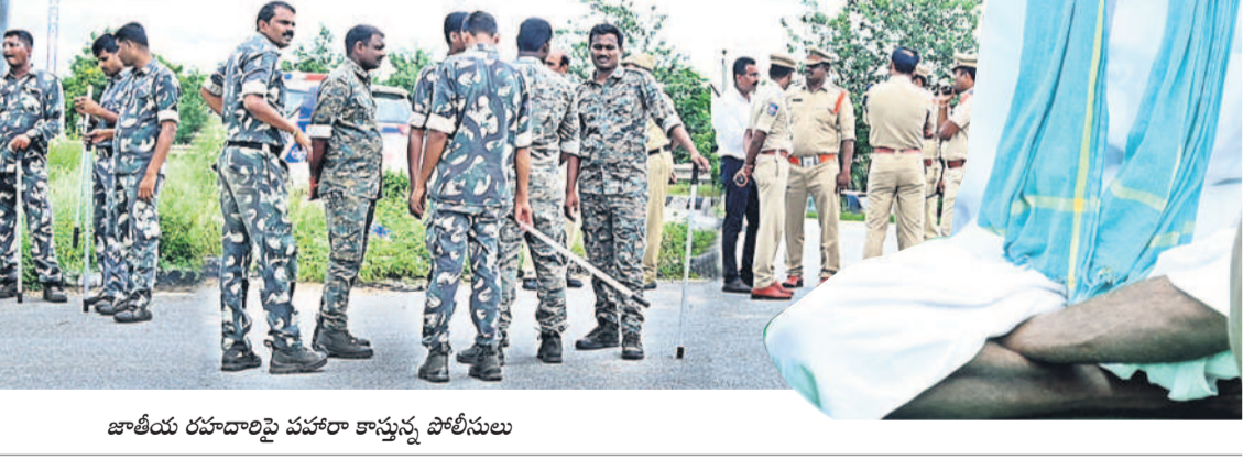
జాతీయ రహదారిపై పహారా కాస్తున్న పోలీసులు