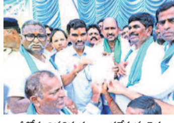
ఆర్మూర్ కు వినతిపత్రం అందజేస్తున్న రైతులు

ఎలాంటి షరతులూ లేకుండా ఏకకాలంలో రూ. 2 లక్షల రుణమాఫీ చేస్తామని హామీ ఇచ్చి గడ్డెత్కిన సీఎం రేవంత్ రెడ్డి.. దారుణంగా మోసం చేశారని అన్నదాతలు ఆగ్రహం వ్యక్తం చేశారు. రైతులతో ఆడుకుంటే ఏమవుతుందో గతంలో చూశారని, ఇచ్చిన మాట ప్రకారం మాఫీ చేయకపోతే రైతుల ఉద్యమం దెబ్బరుచి చూపిస్తామని స్పష్టం చేశారు. ఏ రైతు అయినా మిమ్మల్ని రుణమాఫీ చేయాలని అడిగారా? ముఖ్యమంత్రి పీఠం కోసం మీరే రూ. 2 లక్షల మాఫీ చేస్తామని చెప్పారని విమర్శించారు. రైతులందరికీ రూ. 2 లక్షల రుణమాఫీ చేసే వరకూ పోరాటం ఆగడం సుస్థం చేశారు. సెప్టెంబర్ 15 లోపు సంపూర్ణ రుణమాఫీ చేయాలని గడువు విధించారు. ఆలోచన చేయకపోతే మహాభరణం ఉద్యమాన్ని తలపించేలా పోరాటం