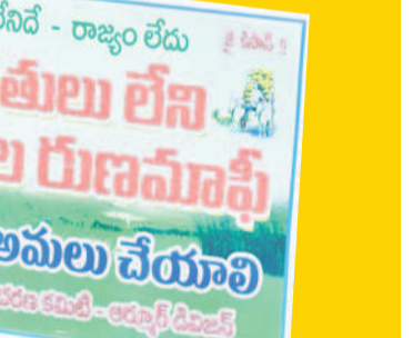
రుణమాఫీ అమలు చేయాలని ఘోషారాలు ప్రదర్శిస్తున్న రైతులు