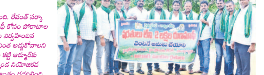
ధర్మా కు తరలివచ్చిన ఆలూర్ మండల రైతులు

ఆర్మూర్ ప్రాంత రైతాంగం మరోసారి కదం తొక్కింది. రేవంత్ సర్కారుకు ఉద్యమ సత్తా దుబి మాలింది. షరతులేని రుణమాఫీ కోసం పోరాటాల గడ్డ ఆర్మూర్ లో రైతు ఐక్య కార్యచరణ కమిటీ శనివారం నిర్వహించిన మహాభరణం దిగ్విజయవంతమైంది. పోలీసు ఆంక్షలతో ఎంత అడ్డుకోవాలని చూసినా అన్నదాతలు లెక్క చేయలేదు. ఊరూరా దండం కట్టి ఆర్మూర్ కు కదిలి వచ్చారు. నిజామాబాద్ దూరల్, ఆర్మూర్, బాల్కొండ నియోజకవర్గాల నుంచి తరలి వచ్చిన రైతుల నినాదాలతో ధర్మా ప్రాంతం దద్దరిల్లింది. షరతులేని రుణమాఫీ, రైతుబలో సా ప్రధాన డిమాండ్లతో రాజకీయాలకతీతంగా నిర్వహించిన ఈ కార్యక్రమానికి బీఆర్ఎస్, బీజేపీ, లెఫ్ట్ పార్టీలు సంఘీభావం తెలిపాయి. రైతుల ఉద్యమానికి అండగా ఉంటామని ప్రకటించాయి. మరోవైపు, వేలాదిగా తరలివచ్చిన ఈ మహాభరణం శాంతియుతంగా ముగియడంతో పోలీసులు ఊరికి వీలయ్యారు.