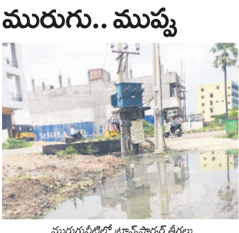
మురుగునీటిలో ట్రాన్స్ ఫార్వర్డ్ తీగలు

కరీంనగర్ ముకరంపుర, ఆగస్టు 23: కరీంనగర్ 19వ డివిజన్ విజయపురి కాలనీలో మురుగు వెంటే ముప్పు పొంది ఉన్నది. కలర్లు నిండా చెత్తా చెదారం పేరుకుపోవడంతో ఎగువ ప్రాంతం నుంచి వచ్చే డ్రైనేజీ నీరు దారిపై మోకాలు లోతు నిలుస్తున్నది. మూడు నెలల నుంచి ఇలానే ఉంటుండగా రాకపోకలకు ఇబ్బంది అవుతున్నది. మరోవైపు ఎన్ఎస్-112 ట్రాన్స్ ఫార్వర్డ్ చుట్టూ నీరు నిలువడం, తీగలు మురుగు నీటిలో మునిగిపోవడం ప్రమాదకరంగా మారింది. ఏదైనా ప్రమాదం జరుగక ముందే అధికారులు స్పందించి మరమ్మతులు చేపట్టాలని స్థానికులు కోరుతున్నారు. రోడ్డుపై రాకపోకలకు ఇబ్బంది లేకుండా చూడాలని డిమాండ్ చేస్తున్నారు.