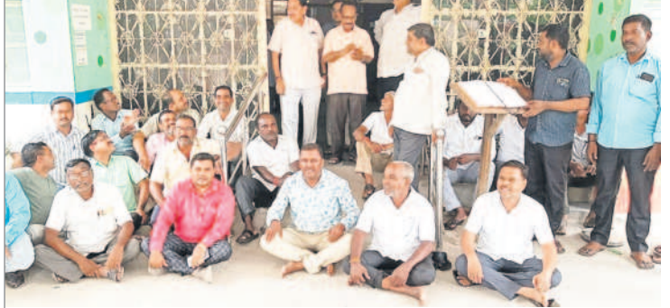
సెన్ కార్యాలయం ఎదుట నిరసన తెలుపుతున్న ఆసాముల సంఘం నాయకులు

5 కరీంనగర్, ఆదివారం 25 ఆగస్టు 2024 PEDDAPALLI