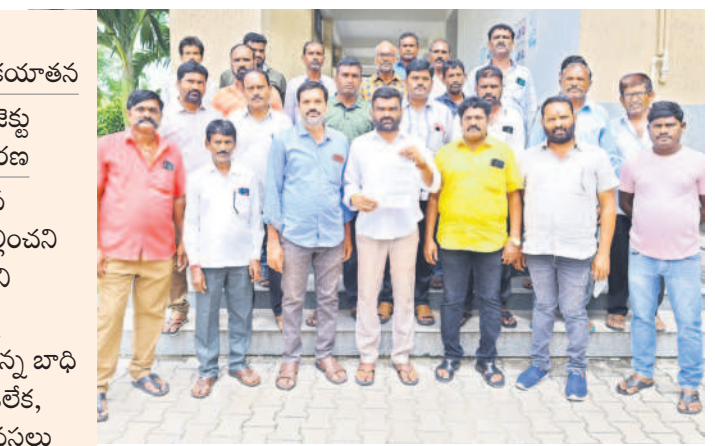
కలెక్టర్ కు వినతి పత్రం సమర్పించేందుకు వచ్చిన పెద్దపేట వాసులు

సింగరేణి అభివృద్ధి కోసం సర్కారు ద్వారా సేకరించిన వారి బతుకుల్లో అందకారం అలుముకున్నది. ఆర్డీ-2 పరిధిలోని ఓ.సి.పీ-3 ప్రాజెక్టు విస్తరణ కోసం విలువైన భూములు, ఇండ్ల వద్దకు వచ్చిన పెద్దపేట నిర్వాసితులకు అన్యాయం చేసిన నిర్ణయం.. పట్టికలోని శాసనం ప్రకారం 'నిర్వాసితులు ఇక్కడ నివాసం ఉండడం లేదని, ఎలా ఇస్తామన్న..? అధికారుల మాటలతో కన్నీటి మింగులా, మరోవైపు ఓ.సి.పీ.కోర్కె బ్యాంకులో దిన దినం గండంగా బతకాలన్న దుస్థితి దాపుంచుంది. పెద్దపల్లి, ఆగస్టు 11(నమస్తే తెలంగాణ): సింగరేణి ఆర్డీ-2 పరిధిలోని ఓ.సి.పీ-3 విస్తరణ కోసం 2007లో రామగిరి మండలం పెద్దపేటలోకి సింగరేణి ప్రవేశించింది. ఉల్కోని విలువైన ఇండ్లు, భూములను తీసుకున్నది. ఈ ప్రకారం అప్పటి ప్రభుత్వం 2,135 నిర్వాసితులకు కుటుంబాలకు జీ.ఓ. 68 ప్రకారం పరిహారం చెల్లింపుల కోసం 2007 నుంచి 2010వరకు అవార్డులు పాస్ చేసింది. 2010లో ఒక్కో కుటుంబానికి సింగరేణి ద్వారా ₹3.25లక్షల పరిహారం ఇవ్వగా 2017లో పునరావాసం కింద ₹4లక్షలను అందజేసింది. అలాగే గ్రామానికి చెందిన రైతులకు ఇలాగే చెల్లించే వరకు సేకరించి, ఒక్కో ఎకరానికి ₹2.50లక్షల అందించింది. ఆ టైంలో సింగరేణి, రెవెన్యూ అధికారులు చేసిన నిర్ణయం 52 కుటుంబాలకు శాసనం మారించింది. పరిహారం అందకుండా పోయింది. అప్పటి నుంచి ఇప్పటి వరకు అనేక పోరాటాలకు దిగుతున్నా ప్రభుత్వం కానీ, సింగరేణి సంస్థ కానీ పట్టికలో పరిహారం లేదు. మరోవైపు ఓ.సి.పీ.కోర్కె నిర్ణయం బ్యాంకులో భయంకర పరిస్థితుల్లో జీవిస్తున్నారు. బాధితుల్లో కొందరు ఊరిని విడిచివెళ్లిపోగా, 20 నుంచి 30 కుటుంబాలతో ఇండ్లు కూలుతున్నాయి గ్రామంలోనే నివసిస్తున్నారు.