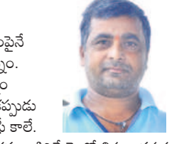
- బెజారపు ముత్యాల, రాఘవపేట

నాకు ఉత్తర రెండెకరాల పొలం ఉంది. ఈ పొలంపైనే అధికారుడే నేను నా బ్యాంకు పిల్లలు బతుకుతున్నం. ఎప్పుడూ కోసం కేడీసీసీ బ్యాంకు రాఘవపేట లోన్ లోన్ తీసుకున్నా. మిత్తి ఎప్పుడీకప్పుడు కట్టుకుంటేనే వస్తున్నా. అయినా నాకు రుణమాఫీ కాలేదు. ఫస్ట్ లిస్టులనే కావాలి కానీ, నా పేరు రాలేదు. సార్లను అడిగితే రెండో లిస్టుల వద్ద న్నా. రెండో లిస్టుల రాలేదు. మూడో లిస్టుల రాలేదు. ఏం కథ అంటే అధికారులు పాస్ పుస్తకానికే, ఇంకదేనికే కట్టకే సరిపోతేమో. అందుకే రుణ మాఫీ కాలేదని బ్యాంకు అధికారులు చెప్పారు. కేలక్షే గింత కథ ఉన్నది. మునుపు కేసీ ఆర్ హయాంలో నాకు లక్ష రూపాయల వరకు మాఫీ అయ్యింది. ఇప్పుడు గిట్ట జేసుకు మంచిగా లేదు.