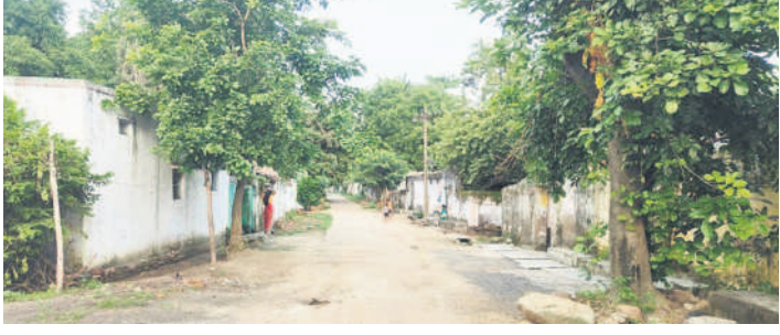
కోర్కె కుటుంబాలు మాత్రమే ఉండడంతో బోసిపోయిన పెద్దపేట వీధి