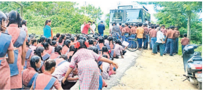
వెంకట్రావుపేట రోడ్డుపై బస్సును ఆపి బయోయించిన విద్యార్థులు

మేట్పల్లి, ఆగస్టు 24: వెంకట్రావుపేటలో విద్యార్థులు రోడ్డుకిన నిరసన తెలుపుతున్నారు. శనివారం ఉదయం జడ్పీ కన్వెంట్ పాఠశాల వద్ద బస్సును ఆపి స్కూలుపోతున్నారని వాపోయారు. 'బస్సు నడపాలంటూ' బాలిలకు ఇబ్బందులు అర్థం చేసుకోండి. సహకరించండి' అని నినాదాలు చేశారు. ఈ విషయమై ఆఫీస్ అధికారులు మిమ్మల్ని పాఠశాల నుంచి పోయిందని అవేదన వ్యక్తం చేశారు. కొద్దిసేపటి తర్వాత దర్యాదిమించి స్కూల్ కు వెళ్లి పోయారు.