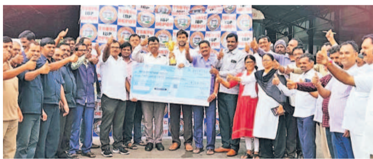
ప్రభుత్వం అందించిన చెక్కతో డిపో మేనేజర్, సిబ్బంది