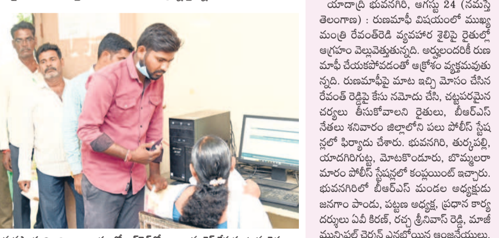
నల్లగొండ జిల్లా వ్యవసాయాధికారి కార్యాలయంలో ఆన్లైన్లో ఖాతాలను వెక చేసుకుంటున్న రైతులు

ఒక్క నల్లగొండ జిల్లాలోనే శనివారం నాటికి 6వేలకు పైగా రుణమాఫీ కోసం రైతుల నుంచి వినతులు వచ్చినట్లు అధికారులు వెల్లడించారు. శుక్రవారం నాటికి 5,840 దరఖాస్తులు రాగా, శనివారం నాటికి 6వేలకు పైగా రుణమాఫీ కోసం రైతుల నుంచి వినతులు వచ్చినట్లు అధికారులు వెల్లడించారు. మిట్టినంటిని ప్రకృతిని చేస్తూ తపాపులను సరిచేసి ఆ వివరాలను ప్రత్యేక సాఫ్ట్ వేర్ లో ప్రభుత్వానికి నివేదిస్తామని అధికారులు వెల్లడించారు. ఇప్పటి వరకు అన్ని ఎలా ఉన్నా గతంలో కేసీఆర్ సర్కారు మాదిరిగా భేదభక్తులు రుణ మాఫీని వర్తింప చేస్తే ఈ ఆవస్థలు ఉండవు కదా అని రైతులు మండిపడుతున్నారు. వ్యవసాయ పనులు ముమ్మరంగా సాగుతున్న సమయంలో తమను ఇలా బ్యాంకులకు చుట్టూ, ఆపీసులకు చుట్టూ తిప్పుడం న్యాయమేనా అని ప్రశ్నిస్తున్నారు.