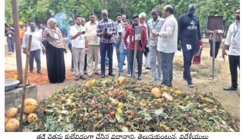
తడి చెత్తను కల్లెవిడంగా చేసిన విధానాన్ని తెలుసుకుంటున్న విదేశీయులు

• కలెక్టర్ హనుమంతు కె.జెండగ్ జువనగిరి కలెక్టరేట్, ఆగస్టు 24 : జిల్లాలో ఈ నెల 27, 29 తేదీల్లో రాష్ట్ర గవర్నర్ జిమ్మి దేవవర్మ పర్యటించనున్నారని, అందుకు అన్ని ఏర్పాట్లు పకడ్బందీ చేయాలని కలెక్టర్ హనుమంతు కె.జెండగ్ అధికారులను ఆదేశించారు. కలెక్టర్ కార్యాలయ కాన్ఫరెన్స్ హాల్లో శనివారం జిల్లా అధికారులతో సమావేశమై గవర్నర్ పర్యటన ఏర్పాట్లను సమీక్షించారు. గవర్నర్ ఈ నెల 27న ఉదయం 8గంటలకు యాదగిరిగుట్ట లక్ష్మీనరసింహ స్వామి దర్శించుకుంటారని, అనంతరం హనుమంతు కె.జెండగ్, జనగాం జిల్లా పర్యటనకు వెళ్లారని తెలిపారు. 29న మధ్యాహ్నం 2:20 గంటలకు ఆలేరులోని జైన, సోమేశ్వర ఆలయాలను, సాయంత్రం 3:30 గంటలకు జువనగిరిలోని స్వర్ణ గిరి ఆలయాన్ని సందర్శించుకుంటారని చెప్పారు. సాయంత్రం 4:15 గంటలకు కలెక్టరేట్లో జిల్లా అధికారులను, 5:15 గంటలకు రవయలు, కళా కార్యాల, ప్రముఖులు, రాష్ట్ర జాతీయ అవార్డు గ్రహీతలను కలుస్తారని తెలిపారు. జిల్లా అధికారులు తమకు కేటాయించిన విధులను పక్కన డిగా నిర్వహించి గవర్నర్ పర్యటనను విజయవంతంగా పూర్తి చేయాలని ఆదేశించారు. సమావేశంలో అదనపు కలెక్టర్ కె.గంగాధర్, వివిధ ములుగు, వరంగల్, జనగాం జిల్లా పర్యటనకు