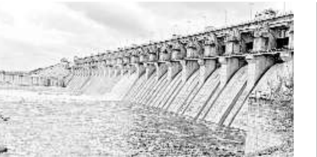
ఎస్సారార్ జలాశయం నుంచి రెండు గేట్లు ద్వారా ఎల్ఎండీకి వెళ్తున్న జలాలు