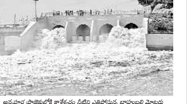
అన్నపూర్ణ ప్రాజెక్టులోకి కాళేశ్వరం నీటిని ఎత్తిపోస్తున్న బావల బలి మోటర్లు

ఇల్లంతకుంట్ల, ఆగస్టు 25 : మండలంలోని అనంతగిరి గ్రామ శివారులోని అన్నపూర్ణ ప్రాజెక్టుకు కాళేశ్వరం జలాలు ఆదివారం భావించి మోటర్ల ద్వారా రోజుకు 6,440 క్యూసెక్కుల నీటిని ఎత్తిపోయడం కొనసాగుతుందని ఏకా సమరసనీ తెలిపారు. రాజరాజేశ్వరం (మధ్య మానేరు ) ప్రాజెక్టు నుంచి గ్రామీణ కెనాల్ ద్వారా తిప్పాపూర్ పంపనోనల్లో గోదావరి జలాలు రాగా భావించి మోటర్ల ద్వారా అన్నపూర్ణలోకి ఎత్తిపోస్తున్నారు. ప్రాజెక్టులో 1.25 టీఎంసీల నీరు నిలువ ఉండగా సిద్దిపేట జిల్లాలోని రంగనాయక సాగర్ గ్రామీణ కెనాల్ ద్వారా నీటిని విడుదల చేశారు.