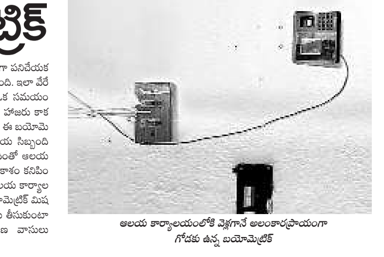
అలయ కార్యాలయంలోకి వెళ్లగానే అలంకారప్రాయంగా గోడకు ఉన్న బయోమెట్రిక్

వేములవాడ టౌన్, ఆగస్టు 24 : ప్రభుత్వ ఉద్యోగులు సమయపాలన పాటించాలనే ఉద్దేశంతో అమలులోకి తెచ్చిన బయోమెట్రిక్ హాజరు విధానాన్ని అరు సమకాలికుల క్రితం అమలులోకి వచ్చింది. ఆరు నెలలపాటు సక్రమంగా పనిచేసిన వ్యక్తికి ఆ తరువాత బయోమెట్రిక్ మిషన్ చనివేయకుండా గోడకు అలంకారప్రాయంగా మారింది. ప్రభుత్వ ఆదేశాలను తూ.నా. తప్పకుండా పాటించాలని అప్పటి అలయ ఈవే ఆదేశాలు కూడా జారీ చేశారు. అయితే కింది స్థాయిలో ఉన్న ఉన్నతాధికారుల నిర్లక్ష్య కారణంగా ఈ విధానం నేటి వరకు సక్రమంగా అమలుకు నోచుకోలేదు. ఇది అలయ కార్యాలయంలో వెళ్లగానే అలంకారప్రాయంగా కనిపిస్తున్నది. దీంతో అలయ సిబ్బంది తమ ఇష్టానుసారంగా విధులకు హాజరవుతున్నారు. అది బయోమెట్రిక్ విధానం అమలులో ఉంటే రాజస్థాన్ అలయ సిబ్బంది హాజరు శాతం, ఎన్ని గంటలకు విధులకు హాజరయ్యారో అనేవి అయంలో ఏర్పాటు చేసిన ఈ బయోమెట్రిక్ మిషన్ మధ్యహ్నం 1 గంట వరకు, మధ్యాహ్నం 1 గంట నుంచి రాత్రి 10 గంటల వరకు పిప్పి వద్దటిలో నీవ్ సక్రమంగా పనిచేసేలా చర్యలు తీసుకుంటారని అటు భక్తులు, ఇటు పట్టణ వాసులు కోరుతున్నారు.