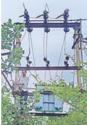
రూపాంతరం శివారులోని ట్రాన్స్ ఫార్మర్ ఫీజులు వేస్తున్న రైతు

సర్పంచలపేట, ఆగస్టు 25 : గ్రామాల్లో కరెంటు పోయినా.. విద్యుత్ వైరు తెగినా పట్టించుకునే వారే లేరు. మరమ్మత్తు చేసేందుకు గ్రామ పౌల్యం అందుబాటులో ఉండకపోవడంతో కరెంటుకు సంబంధించి ఎలాంటి సమస్య వచ్చినా ప్రజలు, రైతులే మరమ్మత్తు చేసుకోవాల్సి వస్తున్న గ్రామాల్లో నెలకొన్నది. మహబూబాబాద్ జిల్లా సర్పంచలపేట మండలంలోని రూపాంతరం గ్రామ చందాయతి పరిధిలోని సబ్ స్టేషన్ కు కూతవేటు దూరంలో ఉన్న 100కీమీ ట్రాన్స్ ఫార్మర్ ఫీజులు పోవడంతో అదివారం కరెంటు సరఫరా నిలిచిపోయింది. దీంతో స్థానికులు ఉదయం నుంచి మధ్యాహ్నం వరకు విలేజ్ హెల్పర్స్ కు పలుమాధు షోన్ చేసినా స్పందించ లేదు. ట్రాన్స్ ఫార్మర్ కు సుమారు కిలోమీటరు దూరంలో ఉన్న బిల్డింగ్ లోని కరెంటు లైన్ లు నాలుగు వేసేందుకు నల్ల అవసరం పడడంతో చేసేది లేక తానే స్వయంగా ట్రాన్స్ ఫార్మర్ ఎక్కి ఫీజులు మేనుకొని తువారితో ట్రాన్స్ ఫార్మర్ ను అదివారం జరిగి రైతు కుటుంబం వీధి పడతే కారణం ఎవరినీ రైతులు ఆగ్రహం వ్యక్తం చేస్తున్నారు. ట్రాన్స్ ఫార్మర్ మరమ్మత్తు కోసం సైబిలు ఇప్పటికే ఎవరూ రావడం లేదని రైతులు ఆరోపిస్తున్నారు. ఇప్పటికైనా సంబంధిత అధికారులు స్పందించి విలేజ్ హెల్పర్స్ చర్యలు తీసుకోవాలని కోములులవ, పాపాలపేట గ్రామాల ప్రజలు, రైతులు కోరుతున్నారు.