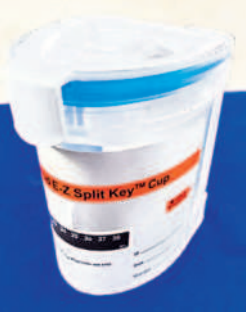
ఏబాన్ టెస్ట్ పరికరం