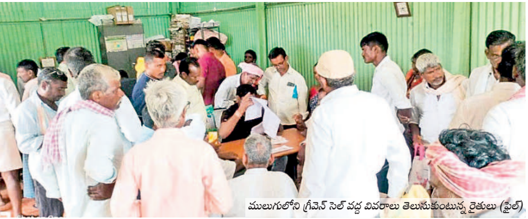
ములుగులోని గ్రీవెన్ సెల్ వద్ద వివరాలు తెలుసుకుంటున్న రైతులు (ఫైల్)