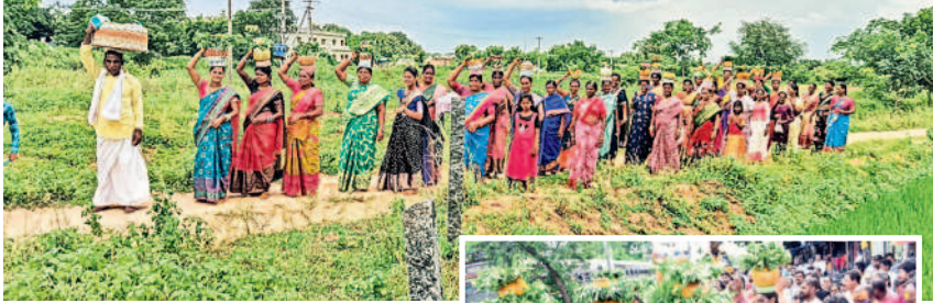
జనగామి రూరల్ : సిద్ధాంతిలో బీరప్రకృతి బోనం తీసుకెళ్లిన యాదవులు

ఉమ్మడి వరంగల్ జిల్లాలో అదివారం బోనాల సందడి నెలకొంది. ఏటా శ్రావణ మాసంలో బోనమ్మ తల్లితో పాటు ఇతర గ్రామదేవతలకు ప్రజలు బోనాలు సమర్పిస్తారు. ఈ సందర్భంగా డప్పు వాయిద్యాలతో ఊరేగింపుగా ఆలయాలకు వెళ్లి అమ్మవార్లకు నైవేద్యాన్ని పెట్టి, ప్రత్యేక పూజలు నిర్వహించి మొక్కులు చెల్లించారు. కొద్ది రోజుల కాలంలోనే మేకలు, గొట్లను బలిచ్చారు. తమను చల్లగా చూడాలంటూ వేడుకున్నారు. సామాజిక బోనాలతో గ్రామాల్లో పండుగ వాతావరణం నెలకొంది. భక్తులకు ఇబ్బందులు కలుగకుండా ఆలయాల వద్ద నిర్మాహకులు ఏర్పాట్లు చేశారు.