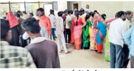
జయశంకర్ ఏపీజీవీలో రుణమాఫీ కాని దూడెకులపల్లి రైతులు

జయశంకర్ భూపాలపల్లి, ఆగస్టు 25 (నమస్తే తెలంగాణ) : జయశంకర్ భూపాలపల్లి జిల్లాలో రుణమాఫీ కాని రైతులు బ్యాంకుల చుట్టూ ప్రదిక్షిణలు చేస్తున్నారన్నారు. జిల్లాలో మొదటి విడుదల 14,079 మంది రైతులకు రూ. 82.25 కోట్లు, రెండో విడుదల 8851 మంది రైతులకు రూ.103.68 కోట్లు, మూడో విడుదల 6753 మంది రైతులకు రూ.113.40 కోట్ల రుణం మాఫీ అయింది. కాగా భూపాలపల్లి మండలం దూడెకులపల్లి గ్రామంలో 152 మంది కాకతీయ గ్రామీణ వికాస బ్యాంకులో రుణం తీసుకోగా కేవలం ఐదుగురికి మాత్రమే రుణమాఫీ అయింది. కాంగ్రెస్ పార్టీకి కంచుకోట అని చెప్పుకొనే ఈ ఊరిలో రైతులకు రుణమాఫీ జరుగకపోవడం చర్చనీ యాంశమైంది. రైతులు బ్యాంకు అధికారులను సంప్రదించినప్పటికీ సరైన సమాధానం చెప్పకపోవడంతో వ్యవసాయ అధికారులకు ఫిర్యాదు చేసేందుకు వెళ్లారు. సర్కారుపై మండిపడుతూ రుణమాఫీ చేయకపోతే ఊరుకునేది లేదని స్పష్టం చేస్తున్నారు.