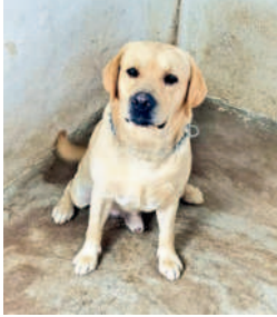
మత్తు పదార్థాలను పసిగట్టే ఘనకం

స్టేషన్ అధికారికి ప్రత్యేక శిక్షణ ఇస్తున్నారు. త్వరలోనే టెస్ట్ డ్రైవ్ లు ప్రారంభించడానికి ఉన్నతాధికారులు చర్యలు తీసుకుంటున్నారు. అదేవిధంగా గంజాయి, మత్తు పదార్థాల వాసన పసిగట్టడానికి కమిషనరేట్ కు టీసీఎస్ ఐ నుంచి రెండు ప్రత్యేక డాగ్స్ వచ్చాయి. ఈ డిస్కలెట్ గంజాయి సాక్షికింగ్ నియంత్రణ చాలా వరకు తగ్గే అవకాశం ఉందని పోలీసులు భావిస్తున్నారు.