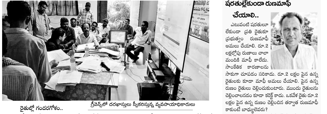
రైతుల్లో గందరగోళం.. గ్రీమ్స్లో దరఖాస్తులు స్వీకరిస్తున్న వ్యవసాయాధికారులు

రుణమాఫీ అమలులో మొదటి విడత నుంచే రైతుల్లో తీవ్ర గందరగోళం నెలకొంది. బ్యాంకుల నుంచి రుణమాఫీ జారీకా సేకరించిన కాంగ్రెస్ సర్కారు.. అనేక నిబంధనలతో అర్హులైన రైతులకు రుణమాఫీ మాఫీ చేయలేదు. అందుకు సాంకేతిక కారణాలను సాకుగా చూపుతోంది. రేపేన్ కార్డు ప్రామాణికం కావటానే దానినే ప్రామాణికంగా తీసుకుంది. భూములను విభజించుకున్న రైతు కుటుంబాలకు కొత్త రేపేన్ కార్డులు అందక ఎక్కువమంది రైతులు అర్హత కోల్పోయారు. ఈ నేపథ్యంలో కొద్దిమందికి రుణమాఫీ అమలు చేయడంలో రైతుల నుంచి తీవ్ర వ్యతిరేకత ఎదురైందోంది. రైతులు కూడా ఎక్కడిక్కడ ఆందోళనలు చేపడుతున్నారు. రైతుల ఆందోళనకు బీఆర్ఎస్ అండగా నిలవడంతో గత్యంతరంలేక రైతుల నుంచి దరఖాస్తుల స్వీకరణకు గ్రీమ్స్ కార్యక్రమాన్ని చేపట్టింది. అర్హులైన రైతుల నుంచి మళ్ళీ దరఖాస్తుల స్వీకరించేందుకు ఏవో, ఏకవోలకు బాధ్యతలు అప్పటిందింది. ఈ బుధవారం నుంచి దరఖాస్తులు అందించేందుకు రైతులు వ్యవసాయ కార్యాలయాల, రైతు వేదికల చుట్టూ తిరుగుతున్నారు. ఈ తరగతులకు అమలును కాలయాపన చేసేందుకే అనేక అవుట్లతో కనిపిస్తోంది. అయినా రుణమాఫీ అయ్యే వరకు రేపంకొత్తెడి సర్కారును వదిలివేట్టే దేదని వారు స్పష్టం చేస్తున్నారు.