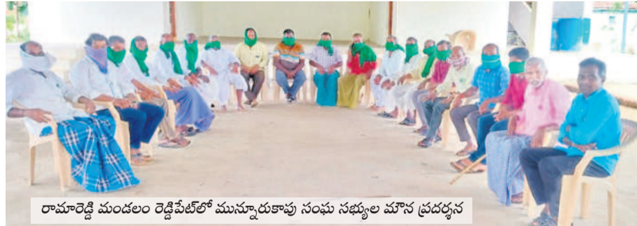
రామారెడ్డి మండలం రెడ్డివేట్లో మున్నూరుకాపు సంఘ సభ్యుల మౌన ప్రదర్శన