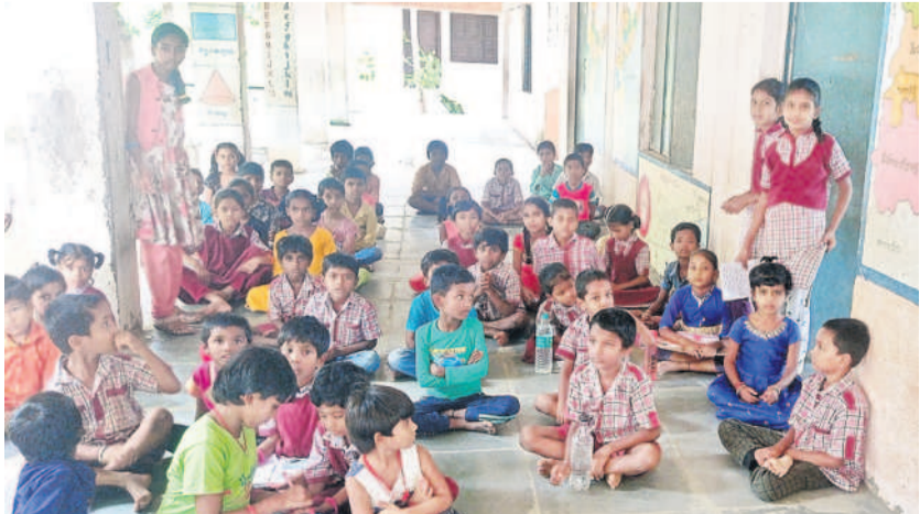
ఒకే పంట కూర్చున్న వివిధ తరగతుల విద్యార్థులు

కృష్ణం వందే జగద్గురమ్ నేడు కృష్ణస్థమి వేడుకలు ఉమ్మడి జిల్లాలో మున్నాబైన ఆలయాలు