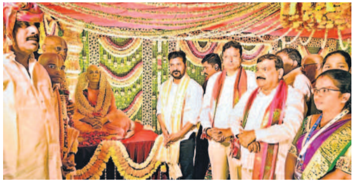
కోకాపేటలో హరిజన్ టవర్ శంకుస్థాపనలో పాల్గొన్న సీఎం రేవంత్ రెడ్డి తదితరులు