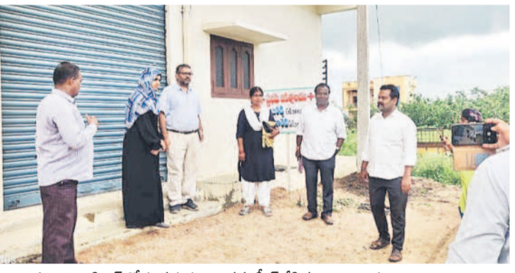
వద్యాజివాడి ఎక్స్ ప్రెస్ వద్ద దవాఖానను సీజ్ చేసిన వైద్యార్థి కార్యులు