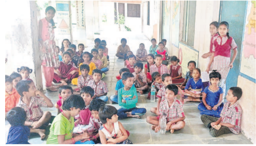
ఒకేవేళ కూర్చున్న, వివిధ తరగతుల విద్యార్థులు

కృష్ణం వందే జగద్గురుమ్ నేడు కృష్ణాష్టమి వేడుకలు ఉమ్మడి జిల్లాలో మున్నాబైన ఆలయాలు