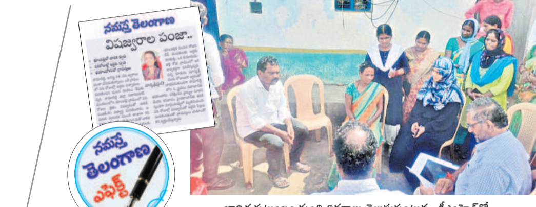
బాధిత కుటుంబం నుంచి వివరాలు తెలుసుకుంటున్న డీఎంహెచ్వో

కృష్ణం వందే జగద్గురుమ్ నేడు కృష్ణాష్టమి వేడుకలు ఉమ్మడి జిల్లాలో మున్నాబైన ఆలయాలు