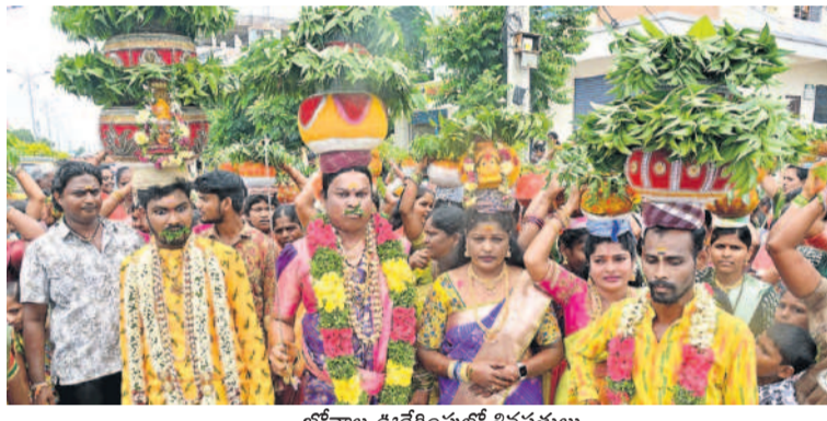
బోనాల దశరథి గోపుల్లో శివసత్తులు