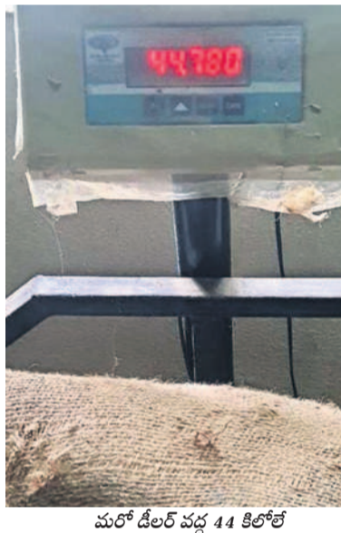
మరో డీలర్ వద్ద 44 కిలోలే

రేషన్ బియ్యం అక్రమాల పాలవుతున్నది. ఇప్పటివరకు రేషన్ డీలర్ల నుంచి వినియోగదారులకు అందించే బియ్యం పక్కదారి పడుతున్నట్లు ఆరోపణలు రాగా ఇప్పుడు ఎఫ్సీఐ, ఎంఎల్ఎస్ పాయింట్ల నుంచి అవకతలు జరుగుతున్నట్లు తెలుస్తున్నది. ఇందుకు డీలర్లకు వచ్చే బియ్యం బస్సెల్లో నిదర్శనం. ఒక్కో బస్సెల్ 50 కిలోలు ఉండాలి, ఉండగా రెండు నాలుగు కిలోల వరకు తక్కువగా ఉంటున్నాయి. డీలర్లకు వచ్చే బియ్యాన్ని ఎంఎల్ఎస్ పాయింట్ల వద్ద దోపిడీ చేస్తున్నట్లు సమాచారం. సూర్యాపేట జిల్లాలో ప్రతినెలా దాదాపు 59,463 క్వంటాళ్ల బియ్యం 1,18,926 డీలర్లకు చేరుతుండగా బస్సెల్ 2 కిలోల చొప్పున తక్కువ పంపకాలు 2,378 క్వంటాళ్ల బియ్యం పక్కదారి పట్టిందే. అంటే సుమారు రూ.55 లక్షలు దోచిస్తున్నారు. ఇలా వచ్చిన సామాన్లు కాంట్రాక్టర్లు, అధికారులు పంచుకుంటున్నట్లు ఆరోపణలు వినిపిస్తున్నాయి.