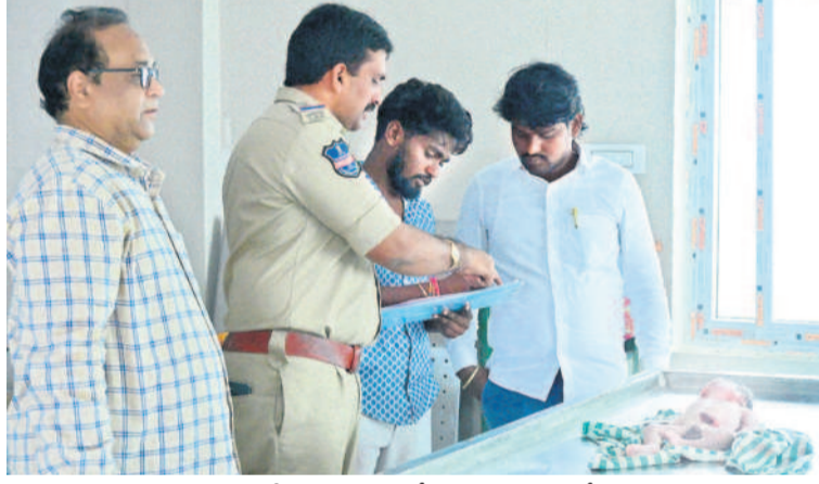
నల్లగొండ జిల్లా కేంద్ర దవాఖానలో శిశువు మృతిపై పోలీసుల విచారణ