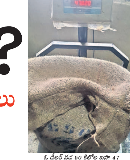
ఓ డీలర్ వద్ద 50 కిలోల బస్సెల్ 47 కిలోలుగా మామిస్తున్న దృశ్యం

డీలర్లకు వచ్చే 50కిలోల బస్సెల్ 2 నుంచి రెండున్నర కిలోల వరకు బియ్యం తక్కువ పస్తున్నట్లు డీలర్లు ఆవేదన వ్యక్తం చేస్తున్నారు. డీలర్లకు రావాల్సిన నికరంగా బస్సెల్ కలిపి 50.50 కిలోలు ఉండాలి, ఉండగా 48 కిలోలు మాత్రమే ఉంటున్నాయి. కొన్ని బస్సెల్లు 45 నుంచి 47 కిలోలే ఉంటున్నాయి. ఇదేమని ప్రశ్నించే డీలర్లపై దాడులు చేసే కిలో నుంచి పది కిలోల తక్కువ ఉన్నా, ఎక్కువ ఉన్నా 6వ కేసులు నమోదు చేస్తున్నందున కిమ్మనకుండా ఉంటున్నారని ఆరోపణలు చేస్తున్నారు. అదే ఎంఎల్ఎస్ పాయింట్ల నుంచి వచ్చే బియ్యాన్ని మాత్రం ఎవరూ తనిఖీ చేయడం లేదని, దానికీ లోలోపల అమ్మమ్మలు అందిస్తున్న కోవడమేనని కారణమని పలువురు ఆరోపిస్తున్నారు.