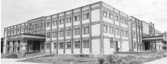
మధిరలో నిర్మాణం పూర్తయిన వంద బెడ్ల ఆసుపత్రి