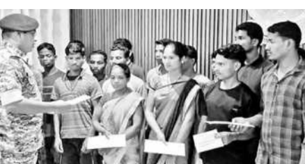
లొంగిపోయిన మావోయిస్టులకు ప్రోత్సాహక నగదు అందజేస్తున్న పోలీస్ ఉన్నతాధికారులు