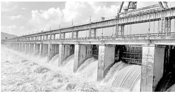
తాలిపేరు ప్రాజెక్టు నుంచి వదిలిన నీరు

చర్ల, ఆగస్టు 26: మండలంలోని తాలిపేరు ప్రాజెక్టుకు ఎగువ ప్రాంతం నుంచి వరద వచ్చి చెరుకుండడంతో అధికారులు సోమవారం 22 గేట్లను రెండు అడుగుల మేర వద్ది 29.236 క్యూసెక్కుల నీటిని గోదావరిలోకి వదిలామని ఏకీకరణ ఉపాధి కమిషన్ తెలిపారు. ప్రాజెక్టు నీటి నిలవ సామర్థ్యం 74 మీటర్లు కాగా ప్రస్తుతం 78.18 మీటర్లుగా కొనసాగుతున్నారని, ఎటువంటి పరిస్థితికైనా ఎదుర్కొనేందుకు సిబ్బందిని అప్రమత్తంగా ఉంచామని ఏకీకరణ తెలిపారు.