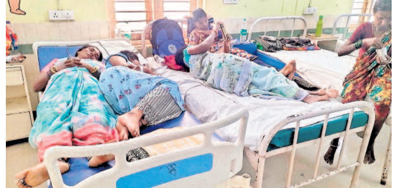
మమలను ప్రభుత్వ దవాఖానలో ఒకే బెడ్ పై ఇద్దరు రోగులు రాష్ట్రంలో హెల్త్ ఎమర్జెన్సీ ప్రకటించాలి > 3 డెంగ్యూతో ప్రజలు చనిపోతున్నారు.. నిజాబ్ దాదిపెద్దను సర్కారు: శేటిఆర్

రాష్ట్రంలో విజృంభిస్తున్న డెంగ్యూ జ్వరాలు ప్రభుత్వ, ప్రైవేట్ దవాఖానలు కిటికీల సర్కారు దవాఖానల్లో మందుల కొరత 600 కోట్ల మందుల బిల్లులు పెండింగ్? కేసులపై డిపీహెచ్ఎస్ తప్పదు లెక్కలు డెంగ్యూ మరణాలేపు: వైద్యారోగ్యశాఖ హైదరాబాద్, ఆగస్టు 26 (నమస్తే తెలంగాణ): జ్వరాలతో తెలంగాణ అల్లాడుతున్నది. ప్రభుత్వం ముందుచూపు లేకపోవడం.. వైద్య, ఆరోగ్య శాఖకు 'మందుల చూపు లేకపోవడంతో ప్రజలు అవస్థలు పడుతున్నారు. డెంగ్యూ, మలేరియా, చికన్ గున్యా, ఇతర విష జ్వరాల విజృంభణతో ప్రభుత్వ, ప్రైవేట్ దవాఖానలు నిండిపోయాయి. ప్రభుత్వ దవాఖానల్లో ఒకే మంచంపై ఇద్దరు, ముగ్గురు రోగులకు చికిత్స >3వ పేజీలో