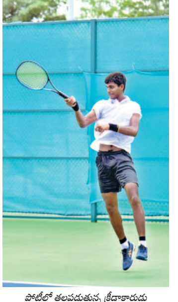
పోటీలో తలపడుతున్న క్రీడాకారుడు

భువనగిరి కలెక్టరేట్, ఆగస్టు 26 : భువనగిరి జిల్లా కేంద్రంలోని స్కూల్ డ్రెమెన్స్ టెన్నిస్ అకాడమీలో రాజా సరసింహారావు మెమోరియల్ ఐటీఎఫ్ పరల్ టెన్నిస్ టూర్నామెంట్ 18 టెన్నిస్ పోటీలు సోమవారం హోరాహోరిగా కొనసాగాయి. ఉదయం బాల బాలికల విభాగాల్లో సింగిల్స్ క్వాలిఫైయింగ్ మ్యాచ్లు జరుగగా, మధ్యాహ్నం తర్వాత మెయిన్ డ్రాస్ ఫస్ట్ రౌండ్ కొనసాగింది. మంగళవారం మెయిన్ డ్రాస్ ఫస్ట్ రౌండ్ ప్రారంభం కానుంది. వచ్చే నెల ఒకటో తేదీ వరకు ఈ పోటీలు జరుగుతున్నాయి.