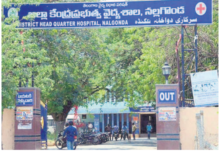
విధుల్లో చేరిన ఎంసీహెచ్ వైద్యులు

జిల్లా జనరల్ దవాఖానలో రక్త, మూత్ర, షుగర్ పరీక్షలు అంతంత మాత్రంగానే చేస్తున్నారు. పరీక్షలకు కావాల్సిన కిట్లు అందుబాటులో లేకపోవడం వల్ల అందుకు రాస్తున్నారు. దవాఖానలో వివిధ శస్త్రచికిత్సలకు వచ్చిన రోగులకు మాత్రమే జిల్లా ప్రయోగశాలలో పరీక్షలు చేస్తున్నారు. సాధారణ జ్వరం, సీజనల్ వ్యాధులతో వచ్చిన వారికి మాత్రం అయిదు చేయం చుక్కోవాలని చెబుతున్నారు. గత ప్రభుత్వం టీ హాట్ ను ఏర్పాటు చేసి 134 రకాల వైద్య పరీక్షలు చేయాలని నిర్దేశించినప్పటికీ అవి పేపర్ కే పరిమితం చేయించి, ఎక్కువ శక్తిమంగా కార్యరూపం దాల్చడం లేదు. జిల్లా వ్యాప్తంగా అన్ని పీహెచ్సీలు, యూహెచ్సీలు, ఏరియా ఆసుపత్రుల నుంచి వచ్చిన వాటికి మాత్రమే పరీక్షలు చేస్తున్నారు.