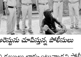
అరెస్టును చూపిస్తున్న పోలీసులు