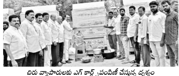
చిరు వ్యాపారులకు ఎగ్ కార్డ్స్ పంపిణీ చేస్తున్న దృశ్యం