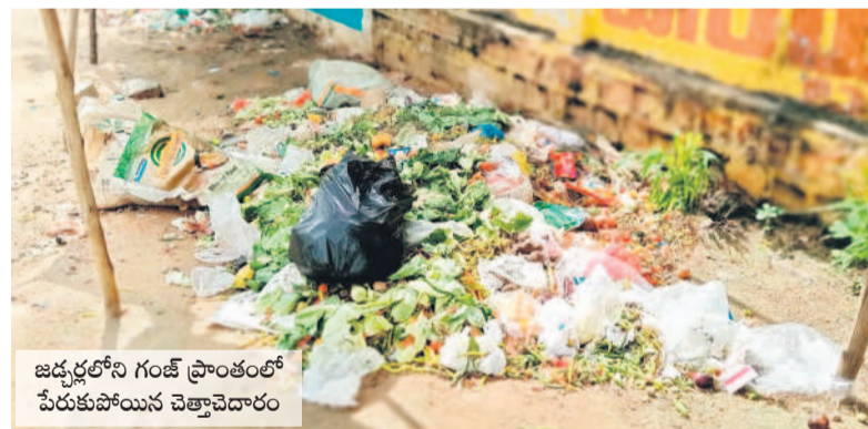
జడ్పీలోని గండ్ల ప్రాంతంలో పేరుకుపోయిన చెత్తావారం

మహాబూబ్ నగర్ మున్సిపాలిటీ, ఆగస్టు 27 : కాంగ్రెస్ సర్కారు చేపట్టిన 'స్వచ్ఛత-పవనం' కార్యక్రమం కేవలం ప్రకటనలు, ప్రచార ఆర్కాటాలతో సరిపోయింది. కానీ అవరణలో మాత్రం సాధ్యం కావడం.. పరిసరాల పరిశుభ్రత మనందరి కర్తవ్యం.. ప్రతిఒక్కరూ వ్యక్తిగత పరిశుభ్రత పాటించాలి.. ఎట్టి పరిస్థితుల్లోనూ బహిరంగ మలమూత విసర్జనను ఉపేక్షించేది లేదు.. అంటూ నిత్యం ప్రజలకు అధికారులు సూచిస్తున్నారు. కానీ వారు విధులు నిర్వర్తించే చోట్ అపరిశుభ్రత రాజ్యమేలు తున్నది. ప్రజల నుంచి వివిధ రకాలైన పన్నులు పూనులు చేయడంపై ఉన్న ధ్యాస.. కార్యాలయానికి వచ్చే వారికి మౌలిక పనులు కల్పించకపోవడం కర్తవ్యం.. ప్రతిఒక్కరూ వ్యక్తిగత పరిశుభ్రత పాటించాలి.. ఎట్టి పరిస్థితుల్లోనూ బహిరంగ మలమూత