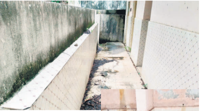
మహాబూబ్ నగర్ లో నీటి సౌకర్యం, పట్టణంకోని ప్రాంతం

చేయాల్సి వస్తున్నదని కార్యదర్శులు వాపోతున్నారు. ప్రత్యేకాధికారులు ఉన్నా ఫలితం శూన్యం.. సర్పంచరుల పదవీకాలం ముగియడంతో రెండు మూడు గ్రామ పంచాయతీలకు కలిపి ఒక ప్రత్యేకాధికారిని నియమించారు. అయితే, వారు ఏనాడూ గ్రామాల్లో పర్చేటింగ్ సమస్యలు తెలుసుకున్న దాఖలాలు లేవు. దీంతో వారి పల్లె ఎలాంటి ప్రయోజనం లేదు. ఇక భారమంతా పంచాయతీ కార్యదర్శులపై మోపడంతోపాటు నిధులు లేకపోవడంతో వారు కూడా చేతులెత్తారు. ప్రస్తుతం వర్షాలు కురుస్తుండడంతో రోడ్డుపై మురుగునీరు వచ్చి చేరుతున్నది. డ్రైనేజీలను కూడా శుభ్రం చేయకపోవడంతో ప్రజలు రోగ బారిన పడుతున్నారు. ఇప్పటికైనా అధికారులు స్పందించి గ్రామాల్లో పారిశుధ్య పనులు చేపట్టాలని ప్రజలు కోరుతున్నారు.