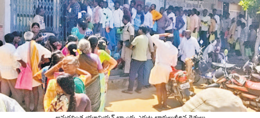
అమరవంత యూనియన్ బ్యాంకు ఎదుట కారులుబిలిన రైతులు