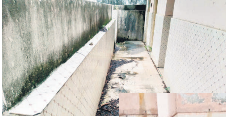
మహబూబ్ నగర్ లో నీటి సౌకర్యం, పక్కనేక్షణ లేక అపరిశుభ్రంగా ఉన్న టాయిలెట్ ప్రాంతం

విసర్జనను ఉపేక్షించేది లేదు.. అంటూ నిత్యం ప్రజలకు అధికారులు సూచిస్తున్నారు. కానీ వారు విధులు నిర్వహించే చోట్ అపరిశుభ్రత రాజ్యమేలు తున్నది. ప్రజల నుంచి వివిధ రకాలైన పన్నులు పూనుతున్నారని చెబుతున్నారన్నారు. కాంగ్రెసులో చేపట్టిన పారిశుధ్యం కనిపించడం లేదన్నారు. ప్రజలకు అధికారులు కొలువయ్యే చోట్ అపరిశుభ్రత రాజ్యమేలు తున్నది.