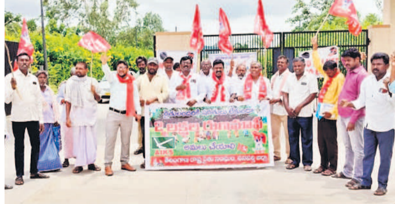
వనపర్తి కలెక్టర్ కార్యాలయం ఎదుట ధర్మా నిర్వహిస్తున్న రైతు సంఘం నాయకులు