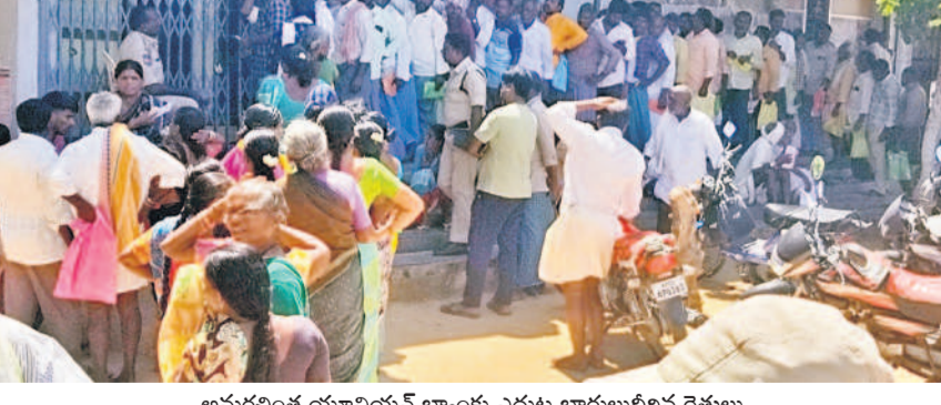
అమరవంత యూనియన్ బ్యాంకు ఎదుట కారులుబిలిన రైతులు