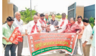
నాగర్ కర్నూల్ లో వినతిపత్రం అందజేస్తున్న నేతలు

తెరుగుకోవడంతో అమరవంత మండలకేంద్రంలోని యూనియన్ బ్యాంకుకు, వ్యవసాయ కార్యాలయానికి మంగళవారం రైతులు భారీగా తలదాచుకున్నారు. తమకు ఎందుకు లబ్ధి చేకూరలేదో సమాధానం చెప్పవలసిందిగా కోరారు. వర్షాన్ని సైతం లెక్కచేయమని అన్నాడతలు అవేదన వ్యక్తం చేస్తున్నారు. ప్రభుత్వం రుణమాఫీ ప్రకటించి 40 రోజులు గడిచినా.. ఇంకా డబ్బులు జమ కావడం లేదని, ఒక్క అమరవంత మండలంలోనే వేల సంఖ్యలో బాధితులు ఉన్నారన్నారు. ఇప్పటికైనా ఎలాంటి షరతులు లేకుండా మాఫీ చేయాలని కోరుతున్నారు. కాగా, మంగళవారం బ్యాంకు అధికారులు పోలీసుల బందోబస్తు మధ్య విడుదల నిర్వహించారు.