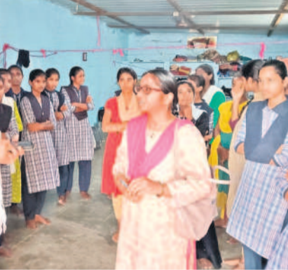
హాస్టల్ లో బాలికలతో మాట్లాడుతున్న తానీల్దార్