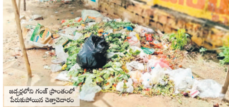
జడ్చర్లలో గంజీ ప్రాంతంలో పేరుకుపోయిన చెత్తావారం

భోజనం కూడా వడ్డించకపోవడమేమిటని ప్రశ్నించారు. వాస్తవ సత్యం ఏమిటో విడుదల చేయమని కోరారు. పరిస్థితి దాపురించినట్లుగా, వీటన్నింటినీ కలెక్టర్ కు నివేదిక సమర్పించామని తెలిపారు. కాగా, విద్యార్థులకు త్వరలోనే తన సొంత నిధులతో దుప్పట్లు, డోర్ రిపేరు, అపరిశుభ్రతను సామగ్రి సమకూరుస్తానన్నారు. కాళ్ళకడం దోమల బెడద తీవ్రంగా ఉన్నదని, కనీసం అల్ట్రావైట్ వంటి ఏర్పాట్లు కూడా చేయలేదన్నారు. మెనూ ప్రకారం