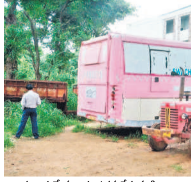
ఆరుబయటే మూత్రవిసర్జన చేస్తున్న నిబ్బంది