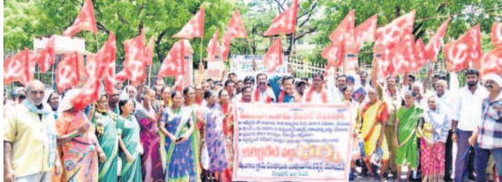
కరింనగర్ కలెక్టరేట్ ఎదుట ధర్మా చేస్తున్న గ్రామపంచాయతీ ఎంపీయార్ అండ్ వర్కర్స్ యూనియన్ నాయకులు

బెయిల్ రావడం సంతోషం రాజకీయ కుట్రలు చేసి ఉద్యమ నాయకులకు కల్లుకుట్ట కవితను అక్రమంగా జైల్లో ఉంచారు. ఎన్ని అవాంతరాలు సృష్టించినా చివరికి న్యాయమే గెలిచింది. మన దేశ అత్యున్నత న్యాయస్థానం సుప్రీంకోర్టు బెయిల్ మంజూరు చేసింది. ఎమ్మెల్యే కవిత కడిగిన ముత్యంలా బయటికి వచ్చారు. చాలా సంతోషం. - మాజీ ఎమ్మెల్యే సునీ రవిశంకర్