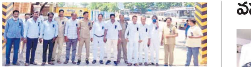
కరింనగర్ డిఎం-1 ఎదుట సబ్ బ్యూజిట్ లో నిరసన తెలుపుతున్న రిజియన్ జేపీసీ నాయకులు

సులువుగా ఆట జూదరూలకు నగదు రహిత ఆట కలిసి వచ్చింది. గతంలో జూదం ఆడేందుకు పెద్ద తరగంమే ఉండేది. జూదం నిర్వహించే స్థలం, రక్షణ మార్గాలు, ఆడే వారికి చాయీ నుంచి మొదలు కొని మందు వరకు ఏర్పాట్లు తదితర వ్యవహారం సాగేది. డింకో నిర్వాహకులు, జూదరూలు పెద్ద మొత్తంలో డబ్బులు తీసు