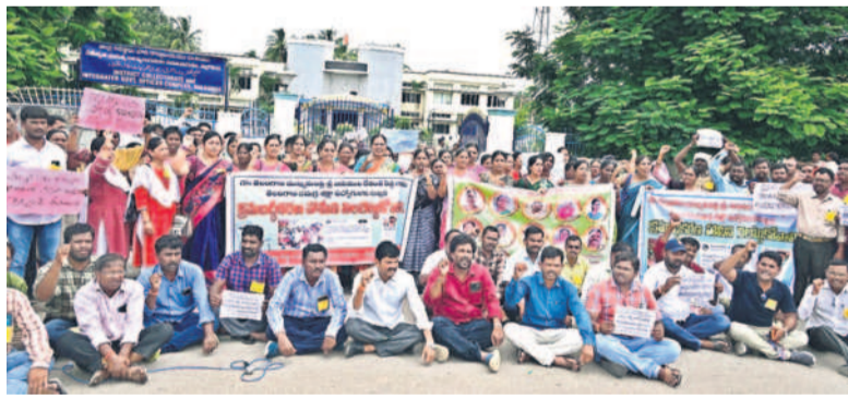
నల్లగొండ కలెక్టరేట్ వద్ద దర్నా చేస్తున్న సమగ్రి శిక్ష ఉద్యోగులు

నందికొండ, ఆగస్టు 28 : నాగార్జునసాగర్ రిజర్వాయర్ వరకు ఉద్ధృతి కొనసాగుతుండడంతో డ్యామ్ 18 క్రస్ట్ గేట్ల ద్వారా నీటి విడుదల చేస్తున్నారు. శ్రీశైలం నుంచి 1,94,758 క్యూసెక్కుల ఇన్ ఫ్లో వచ్చి చేరుతుండడంతో డ్యామ్ 18 క్రస్ట్ గేట్ల ద్వారా 1,45,800 క్యూసెక్కుల నీటిని విడుదల చేస్తున్నారు. ఈ ఏడాదిలో ఆగస్టు 5న క్రస్ట్ గేట్ల ద్వారా నీటి విడుదల ప్రారంభించి 12 వరకు, మళ్లీ 14 నుంచి 19 వరకు నీటిని విడుదల చేశారు. మూడో సారి ఈ నెల 28వ తేదీన మళ్లీ క్రస్ట్ గేట్ల ద్వారా నీటి విడుదలను ప్రారంభించారు. ఇప్పటి వరకు 140 టీఎంసీలను క్రస్ట్ గేట్ల ద్వారా విడుదల చేశారు. దాంతో పాటు జలవిద్యుత్ కేంద్రాలు, కాల్వల ద్వారా కలిపి మొత్తం 228 టీఎంసీల నీటిని విడుదల చేశారు. బుధవారం ఉదయం రెండు క్రస్ట్ గేట్ల ద్వారా నీటి విడుదల కొనసాగుతుండగా శ్రీశైలం నుంచి ఇన్ ఫ్లో పెరుగడంతో డ్యామ్ గేట్లను క్రమంగా 18 వరకు తెరిచారు.