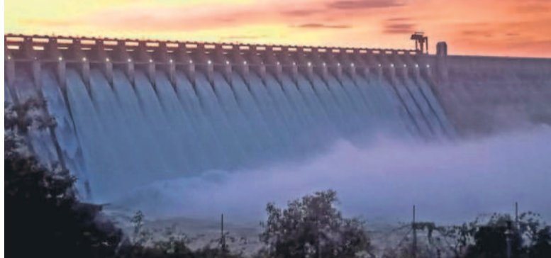
నాగార్జున సాగర్ డ్యామ్ 18 క్రస్ట్ గేట్ల ద్వారా కొనసాగుతున్న నీటి విడుదల