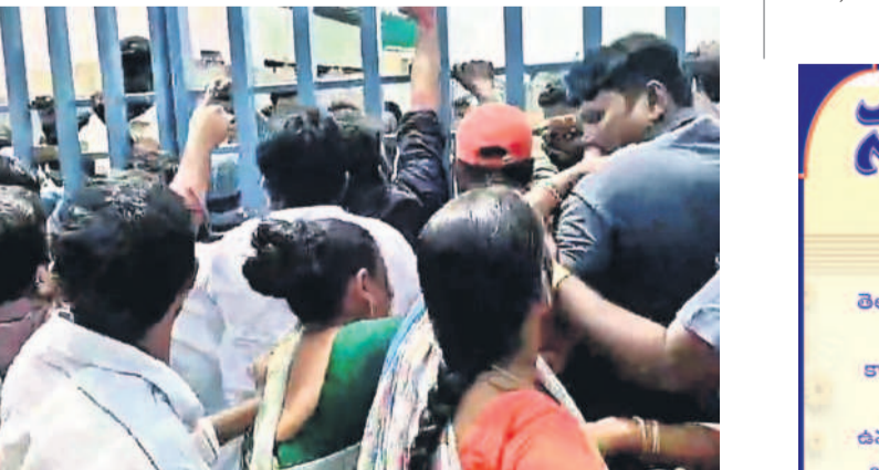
సంగం డెయిరీ వద్ద ఆందోళన చేస్తున్న రైతులు

నడపాలని డిమాండ్ చేశారు. గతంలో వీటి డెయిరీలో 500 మంది వరకు ఉపాధి పొందగా, ప్రస్తుతం సంగం డెయిరీ వారు అంధ్రా ప్రాంతం నుంచి వచ్చిన తీసుకువచ్చిన పనులు చేయిస్తున్నారని, స్థానికులకు ఉపాధి కల్పించాలని కోరారు. కాగా, వీటి ద్వారానే తాము పెట్టుబడులు పెట్టడమే గాక పాటు పోయడం జరిగిందని, ఆ డబ్బులను వీటి ద్వారానే యాజమాన్యం ఇచ్చలేదని వాపోయారు. ఆ బాధానికరమైన తర్వాత సంగం డెయిరీ