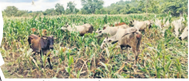
అటవీ భూమిలో వేసిన మక్కజొన్న వంటిలోకి పశువులను వదిలిన గౌరారం గ్రామస్థులు

గాంధారి, ఆగస్టు 28: కామారెడ్డి జిల్లా గాంధారి మండలంలోని గౌరారం గ్రామస్థులు అడవుల సంరక్షణకు కదిలారు. అడవులను ఆక్రమించే వేసిన గుడిసెలను ఇటీవలే ధ్వంసం చేసిన స్థానికులు.. తాజాగా అటవీ భూముల్లో సాగు చేసిన పంటలోకి బుధవారం పశువులను వదిలారు. చెట్లను ఆక్రమించిన స్థలంపై అడవి కనుమరుగై పోతుందిని గ్రామస్థులు.. పచ్చదనం పెంపొందించడానికి నడుం బిగించారు. అందులో భాగంగా బుధవారం అటవీ శాఖ అధికారులతో కలిసి తమ గ్రామ శివారులోని అటవీ భూముల్లో ఆక్రమించిన సాగు