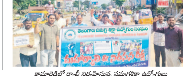
కామారెడ్డిలో రాష్ట్ర నిర్వహిస్తున్న నమగ్రశిక్షా ఉద్యోగులు