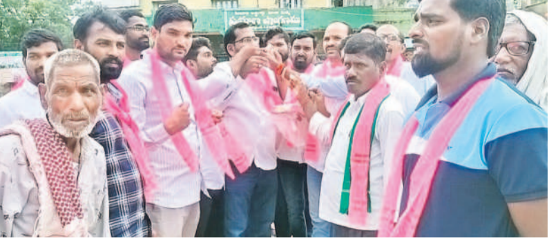
నస్రుల్లాబాద్లో స్వీట్లు తినిపించుకుంటున్న బీఆర్ఎస్ నాయకులు