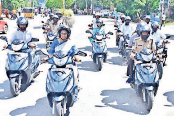
హెల్మెట్ ధరించి ద్విచక్రవాహనం నడుపుతున్న జిల్లా జడ్జి, ఎస్సీ, అధికారులు