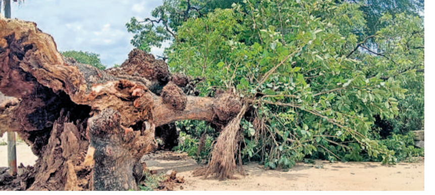
వారు. ఇంతటి పేరున్న ఈ చెట్టు అనుకోకుండా గురువారం మధ్యాహ్నం ఇలా పడిపోయింది. దశాబ్దాలుగా సేవలందిస్తున్న ఈ మహావృక్షం ప్రస్థానం ముగియడంతో ప్రజలు ఒకింత మడనపడుతున్నారు. - దేవయ్యల, ఆగస్టు 29

కామారెడ్డిగుండంలో గిర్డావర్ చెట్టుగా చెప్పుకునే 150 ఏళ్ల నాటి వేప చెట్టు గురువారం నేలకూలింది. శైజాం జమానాలో ఈ చెట్టు కింద కూర్చొని రెవెన్యూ కార్యకలాపాలు చేసేవారని గ్రామస్థులు చెబుతారు. రైతులు తమ భూముల వివరాలు సేకరించడం, శిష్య పనుళ్లను పట్టారీలు ఈ చెట్టు కింద చేసేవారని అంటారు. కాలక్రమేణా ఈ చెట్టు గిర్డావర్ చెట్టుగా రూపాంతరం చెందగా, గ్రామస్థులు తమ పంచాయతీ తీలను ఈ చెట్టు కింద పెట్టుకునే