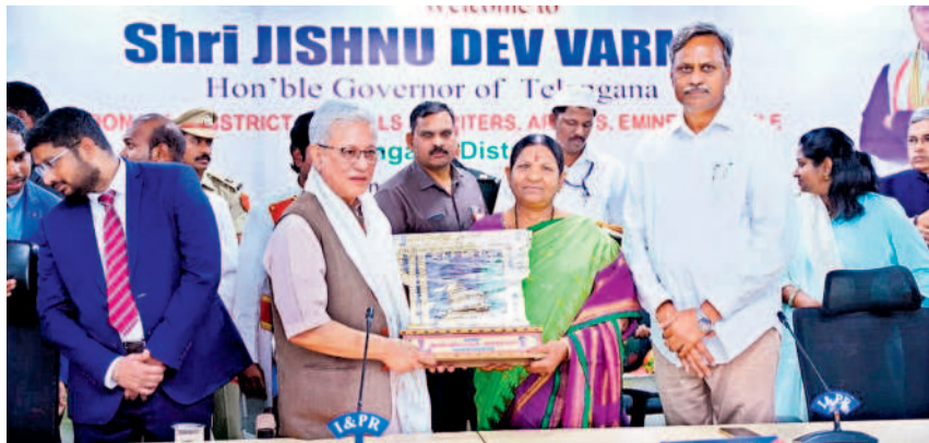
జనగామలో గవర్నర్ జిష్ణుదేవ్ వర్మకు జ్ఞాపికను అందజేస్తున్న మున్సిపల్ చైర్మన్ల జమున, చిత్రలో ఎమ్మెల్యే పల్లా