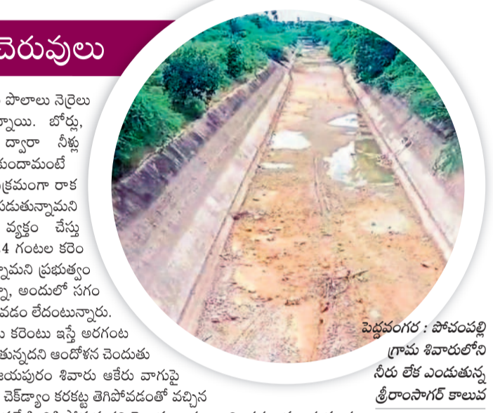
పెద్దవంగర : పోచంపల్లి గ్రామ శివారులోని నీరు లేక ఎందుతున్న శ్రీరాంసాగర్ కాలువ

వేసిన పరి పొలాలు నెర్రెలు బారుతున్నాయి. బోర్లు, బావుల ద్వారా నీళ్లు పారింతుకుండామందే కరెంట్ సక్రమంగా రాక ఇబ్బంది పడుతున్నామని ఆవేదన వ్యక్తం చేస్తున్నారు. 24 గంటల కరెంట్ ఇస్తున్నామని ప్రభుత్వం చెబుతున్నా, అందులో సగం కూడా రావడం లేదంటున్నారు. పొవుగంట కరెంటు ఇస్తే అరగంట పొలు బారుతుంది అందోళ్ళన చెందుతున్నారు. జిల్లాపైరు శివారు ఆకేరు వాగుపై నిర్మించిన చెక్ డ్యాం కర్రకట్ట తెగిపోవడంతో వచ్చిన నీరు వచ్చినట్టి కిందికి పోతున్నదని చెబుతున్నారు. ఇక పెద్ద వంగర మండలంలోని శ్రీరాంసాగర్ కాలువ పరిపాహక ప్రాంతాల్లో వందల ఎకరాల్లో పంట పొలాలు ఎండిపోతున్నాయి. ఉప్పరగూడెం, పోచంపల్లి, పెద్దవంగర, గంట్లకుంట, కొంభల్లి గ్రామాల్లో పరి, పత్తి, మక్కజొన్న పంట పొలాలు సాగునీరు లేక నెర్రెలు బారుతున్నాయి. ఇప్పటికైనా కాంగ్రెస్ ప్రభుత్వం శ్రీరాంసాగర్ ద్వారా సాగునీరు అందించే ఆడుకోవాలని రైతులు కోరుతున్నారు. నిండని చెరువులు.. తొర్రూరు డివిజన్ లోనే అతిపెద్ద చెరువుగా ఉన్న మాటేడు గణపంమండ్రంలో నీరు లేక ఎండిపోయే దశకు చేరుకుంది. ఎనిమిదేళ్లుగా ఈ చెరువు ఈ సమయంలో వర్షాలు, గోదావరి జలాలతో