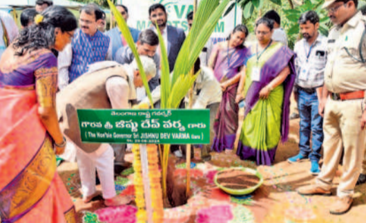
ఓబుల్ కేశావూర్ గ్రామంలోని వేంకటేశ్వర ఆలయంలో మొక్క నాటుతున్న గవర్నర్