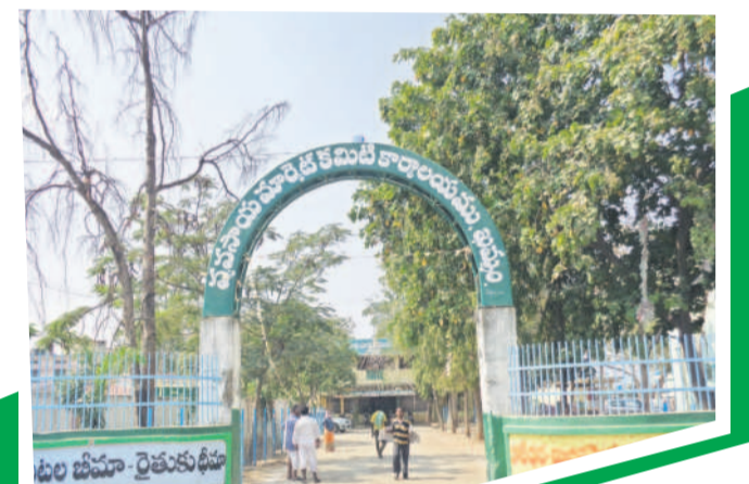
పాటూరు రైతులకు ధర పెరగాల్సి ఉంది

గడిచిన వారం రోజులుగా ఖమ్మం వ్యవసాయ మార్కెట్కు కొత్త పెసర పంట వస్తోంది. జిల్లా రైతులతోపాటు పొరుగు జిల్లాల రైతులు ఇక్కడికి తమ పంటను తెస్తుంటారు. కొద్ది రోజుల క్రితం కేరళ, తమిళనాడులో భారీ వర్షాలకు అక్కడి అపరాల పంటలు తుడిపిపెట్టు కపోయాయి. దీంతో అక్కడి వ్యాపారులు నారాయణపేట, తాండూర్ ప్రాంతాలకు వచ్చి భారీగా కొనుగోళ్లు చేపడుతున్నట్లు తెలుస్తోంది. ఈ క్రమంలో ఖమ్మం మార్కెట్లోనూ ప్రైవేట్ ధర పెరగాల్సి ఉంది. కానీ.. అందుకు భిన్నంగా ఇక్కడి వ్యాపారులు వ్యవహరిస్తున్నారు. ధర సన్నగా ఉందని, పచ్చడం లేదని సాకులు చెబుతూ క్వింటాకు రూ.వెయ్యి నుంచి రూ.రెండు వేల వరకూ ధరను తగ్గిస్తూ కొనుగోలు చేస్తున్నారు. బుధవారం అపరాలకు ఖమ్మం ఏఎస్సీలో క్వింటాకు రూ.7,100 వెచ్చించిన ఖరీదుదారులు.. గురువారం ఉదయం క్వింటాకు రూ.6,830 మాత్రమే ధర నిర్ణయించడం గమనార్హం.