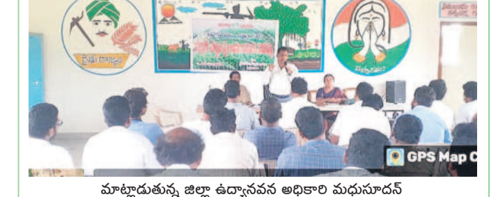
మాట్లాడుతున్న జిల్లా ఉద్యోగసవన అధికారి మధుసూదన్

బాధిత రైతులు ఫిర్యాదు చేస్తే చర్యలు తీసుకుంటాం.. జిల్లా ఉద్యోగసవన అధికారి మధుసూదన్