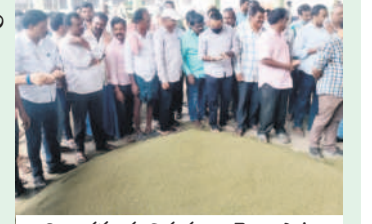
నిబంధనలకు విరుద్ధంగా జెండాపాట నిర్వహిస్తున్న ఖరీదుదారులు

ఖమ్మం వ్యవసాయం, ఆగస్టు 29 : 'ఈ నామ్ ఈనామ్.. జెండాపాట జెండాపాటే..' అనేలా ఉంది ఖమ్మం ఏఎస్సీలో ఖరీదుదారుల తీరు. మిర్చి మినహా పత్తి, అపరాల విక్రయంలో ఈనామ్ (జాతీయ వ్యవసాయ మార్కెట్ విధానం) అమల్లో ఉన్నప్పటికీ ఖరీదుదారులు దానికి ఎగనామం పెడుతున్నారు. సాక్షాత్తు ఏఎస్సీ సిబ్బంది ఎదుటి జెండాపాట నిర్వహిస్తున్నారు. 'అక్కడ జెండా లేదుగా? అది జెండా పాట ఎలా అవుతుంది?' అంటూ సాంకేతిక కారణం చెబుతున్నారు గానీ అక్కడ జరిగిందే మాత్రం జెండా పాటే. దీంతో ఈనామ్ విధానానికి, సీక్రెట్ బిడ్డింగ్కు అర్థం ఏముందన్న ప్రశ్న రైతుల్లో తలెత్తింది.