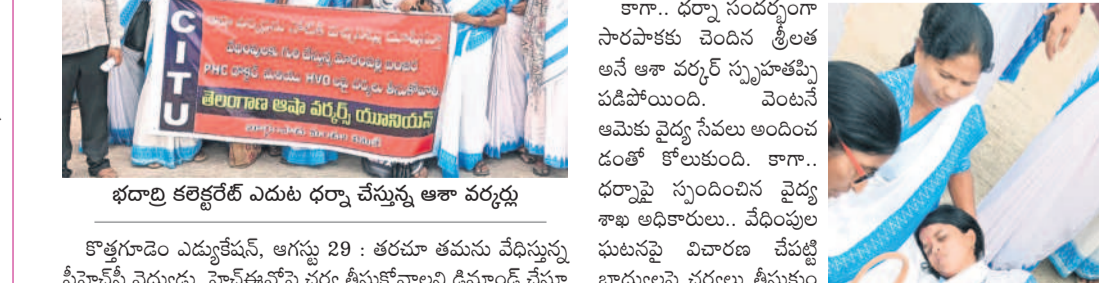
భద్రాద్రి కలెక్టరేట్ ఎదుట ధర్మా చేస్తున్న ఆశా వర్షల్లు