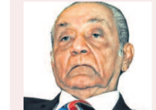
న్యాయ కోవిదుడు ఏజీ నూరాని కన్నుమూత

బెంగళూరు, ఆగస్టు 29: కర్ణాటకలో బీర్లు తాగేవాళ్లకు రాష్ట్ర ప్రభుత్వం పాకే ఇవ్వాలి తున్నది. రాష్ట్రంలో బీర్ల ధరల్ని రూ.10 నుంచి రూ.30 వరకు పెంచాలని కాంగ్రెస్ ప్రభుత్వం భావిస్తున్నట్లు కమిటీకి చైర్మన్ గా మంత్రి పాటిల్ ఉన్నారు. ఈ భూకేటాయింపులో బంబులపేరి, పక్షపాతం ఉన్నాయనే ఆరోపణలు వెల్లువెత్తుతున్నాయి. ప్రమాటర్ల వివరాలపై గోప్యత ఈ స్థలంలో మల్లికార్జున్ డివలప్ మెంట్ సెంటర్ నిర్మాణానికి రూ.25 కోట్ల వ్యయం అవుతుంది ఈ (బ్రహ్మకు సమర్పించిన ప్రాజెక్టు రిపోర్టులో పేర్కొన్నారు. ఇందులో రూ.10 కోట్లు ప్రమాటర్లు పెట్టుబడి పెడతారని, మరో రూ.10 కోట్లు బ్యాంకుల నుంచి రుణం తీసుకుంటామని, రూ.5 కోట్లు వర్గంగా క్యాబినెట్ లోగా పెడతామని (బ్రహ్మకు పేర్కొన్నారు. అయితే, రూ.10 కోట్లు పెట్టుబడి పెట్టే ప్రమాటర్లు ఎవరనే విషయాన్ని వెల్లడించకపోవడంపైనా ఆసక్తి మూలకం వ్యక్తమవుతున్నాయి. ఈ సెంటర్ లో యువతకు ఆటోమొబైల్, సాఫ్ట్వేర్ వైభవాన్ని లక్ష్యం పెట్టాలని (బ్రహ్మకు పేర్కొన్నారు. అయితే, ఈ రంగంలో (బ్రహ్మకు ఉన్న అనుభవ వానికి సంబంధించిన ఆధారాలను మాత్రం సమర్పించలేదని దినేష్ కల్లెఫోర్ ఆనే సామాజిక కార్యకర్త ఆరోపించారు. మిగతా దరఖాస్తులు అన్నింటినీ సెంటర్ పెట్టెండుకు ఒక్క (బ్రహ్మకు దరఖాస్తును మాత్రమే కమిటీ పరిగణనలోకి తీసుకున్నదని, ఇది బంబులపేరి, అమీ సిఐ అని దినేష్ పేర్కొన్నారు.