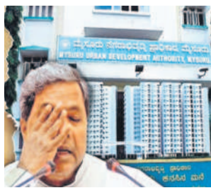
విలువ ఇప్పుడు అక్షరాలు రూ.65 కోట్లు.

బెంగళూరు, ఆగస్టు 29: ముదా భూకేటాయింపు కుంభకోణంలో కర్ణాటక ముఖ్యమంత్రి సిద్ధరామయ్య పేర్కొన్నారు. అయితే, ఇందుకు పూర్తి విరుద్ధంగా ఉన్న ఒక లేఖ బయటకు వచ్చింది. కేసీఆర్ గ్రామంలో ఇచ్చిన భూమికి బదులుగా తనకు ఫలానా ప్రాంతాల్లో స్థలాలను కేటాయించాలని కోరుతూ 2014లో సిద్ధరామయ్య ముఖ్యమంత్రిగా ఉన్నప్పుడు ముదాకు పాల్గొని లేఖ రాశారు. స్థలాల కావాలని లేఖలో పేర్కొన్నవి ఖరీదైన ప్రాంతాలు. అయితే, లేఖలో పేర్కొన్న ప్రాంతాల పేర్లను తర్వాత వైట్‌నెట్ తో తుడిపేశారు. కాగా, పార్లమెంటులో సిద్ధరామయ్య కేటాయించేందుకు 3,500 స్థలాల ఉన్న పుట్టి ఖరీదైన విజయనగర్ లోనే ముదా కేటాయించడం విషయం అత్యధికంగా వెలుగులోకి వచ్చింది. ఈ స్థలాన్ని కేటాయించు 2020లో నిర్ణయం జరిగిన ముదా సమావేశంలో సిద్ధరామయ్యకు మారుమూల యంత్రం ఎమ్మెల్యే హోదాలో పాల్గొన్న విషయం వెలుగులోకి వచ్చింది. దీంతో సిద్ధరామయ్యపై ప్రాంతంలో పార్లమెంటు బలపడుతున్న స్థలాల