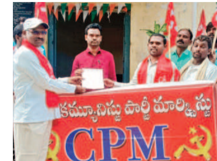
గద్దాల : వినతిపత్రం అందజేస్తున్న నాయకులు