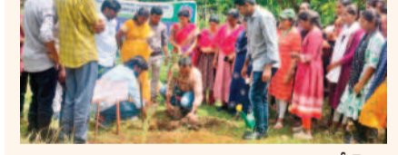
మొక్క నాటాడున్న విద్యార్థులు, కళాశాల డి.న